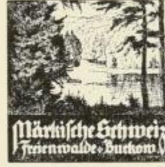
Märkische Schweiz Ferienwalde, Buchow

Hansa-Verlag für Literatur und Kunst, Leo Kaset, Berlin - Leipzig.