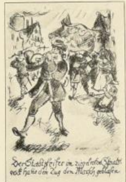
Aus Riehl, Stadtpfeifer