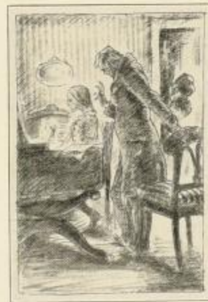
Aus Storm, Ein stiller Musikant