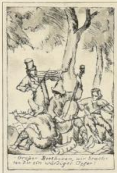
Aus Wagner, Pilgerfahrt