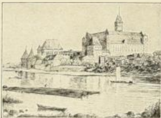
No. 71: Marienburg