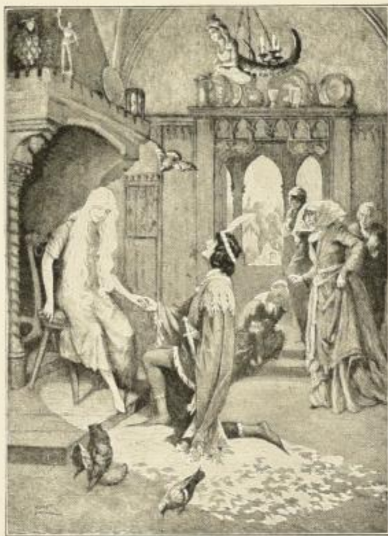
N. 4: Aschenbrödel

Empfehlen Sie meine Neu- heiten, besonders meine neuen Märchen- und Fabelbilder nach Originalen von Käthe Ols- hausen-Schönberger, Prinz- Wienu. A. zur Anschaffung in Schule und Haus!