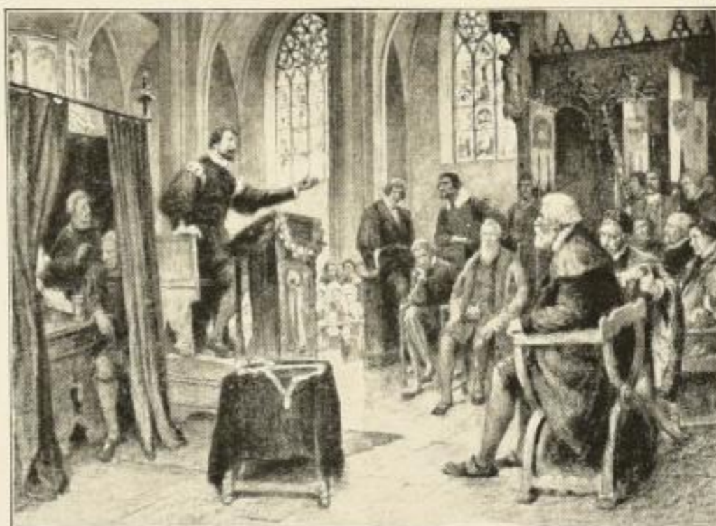
No. 28: Meistersinger (Singschule im Anfang des XVI. Jahrhunderts)

Grosse farbige An- schauungsbilder für alle Zweige des Schulunter- richts