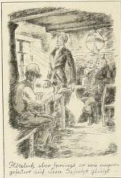
Aus Söhle, Eroika

Karl Söhle Eroika mit 3 farb. Origin.-Lithographien und Einbandzeichnung von Willi Harwerth