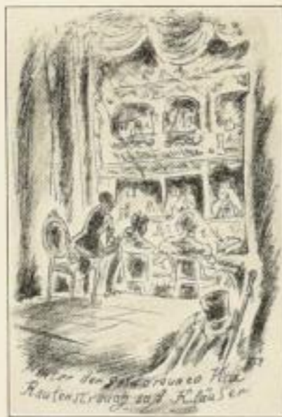
Aus Bartsch, Eine Altwiener Geschichte