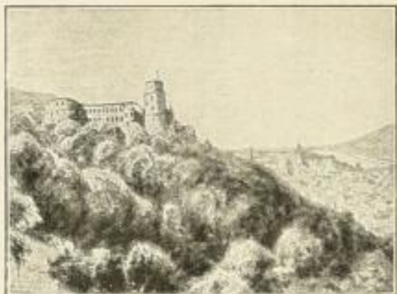
No. 69: Heidelberg

Aus Ad. Lehmann, „Geographische Charakterbilder“, Grösse 66×88 cm, Preis ord. 2.20 Gm.