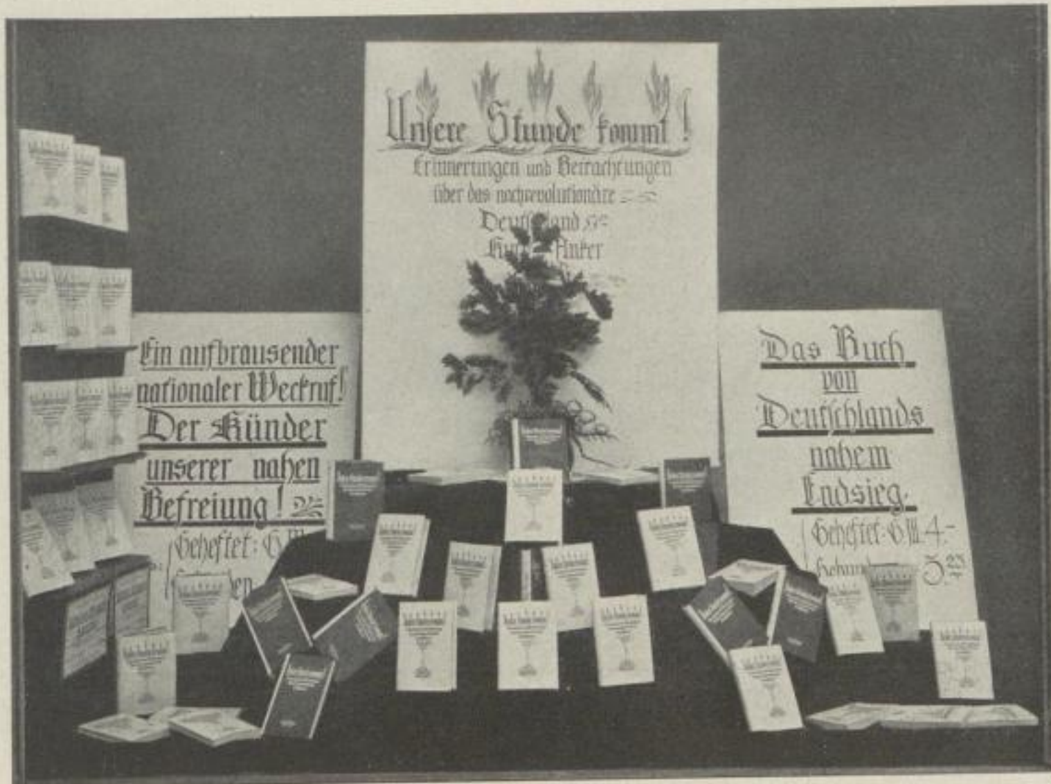
Sonderfenster der J. E. Hinrichs'schen Buchhandlung, Leipzig