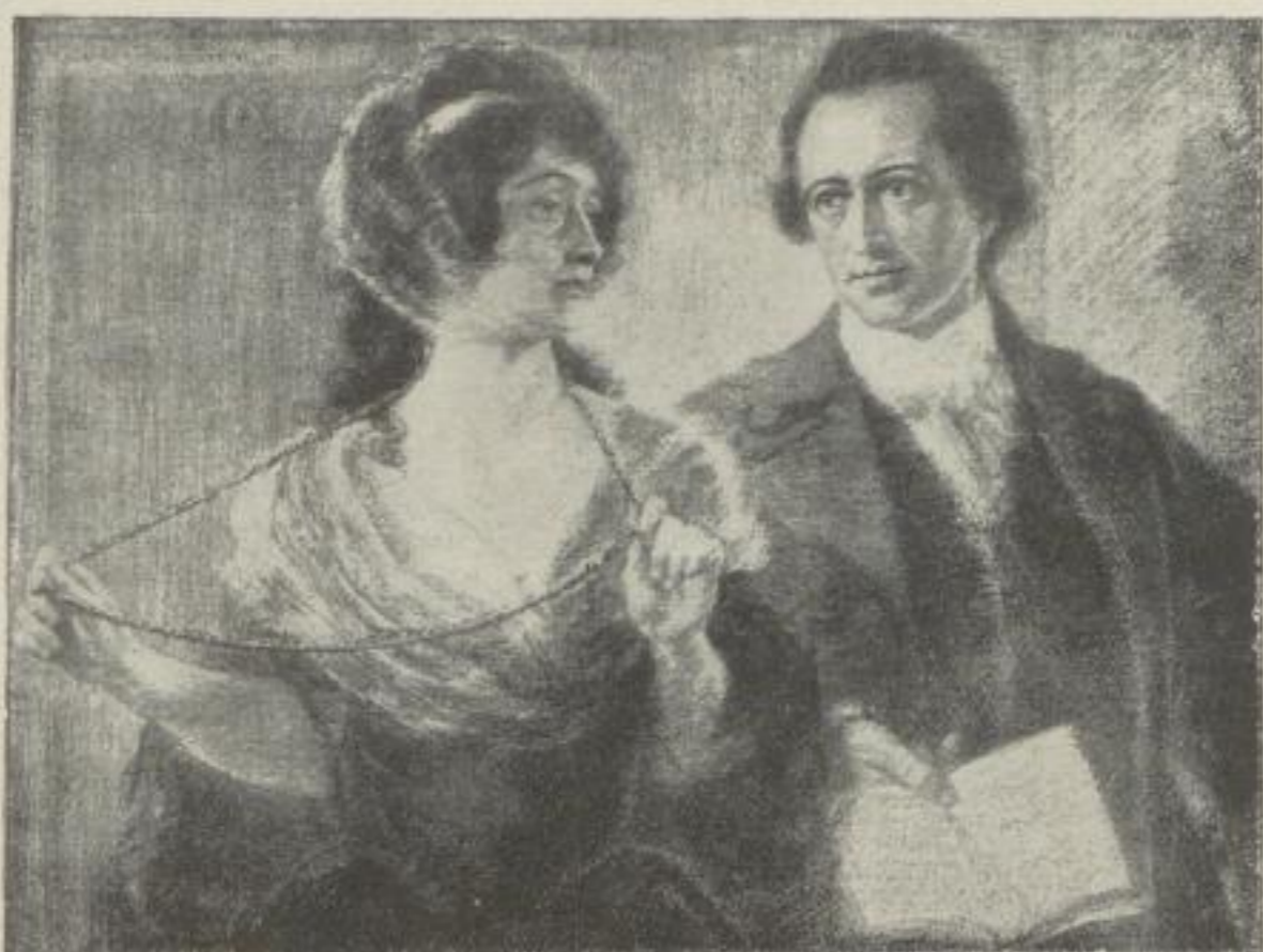
Nach einer großen Steinzeichnung von Karl Bauer