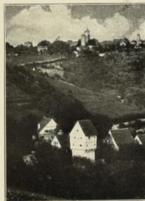
Rothenburg ob der Tauber

Den Urquell deutscher Kraft „anschaulich“ zu machen, war meine Absicht. Das ist es, was vielen von uns abhanden gekommen ist, das „Seh“vermögen, das Vermögen heißt das, die Welt mit deutschen Augen, und das ist mit den eigenen, „anzuschauen“. Darum war und ist es selbst jetzt noch möglich, daß so viele unserer Volksgenossen haltlos den Lockrufen der land- und rassenfremden falschen Propheten verfielen und leider noch täglich verfallen. Hier gilt es einzusetzen.