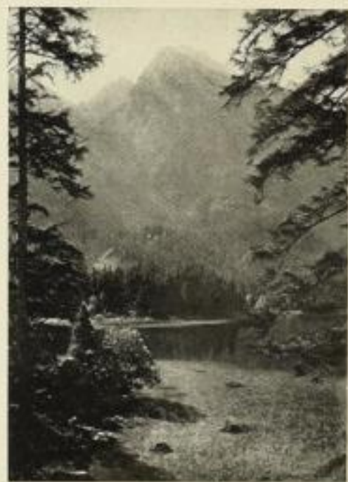
Gintersee bei Reichsteigaden

Zweiter Teil: Vom Rennsteig durch Süddeutschland zur Rheinpfalz. 225 Bilder u. 9 Kupfertiefdrucktafeln Jeder Teil in Halbleinen M. 50.—, in Ganzleinen M. 55.—