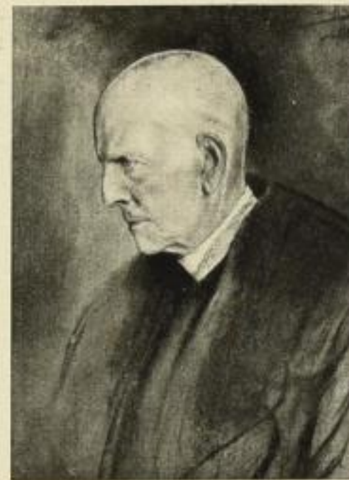
Helmuth v. Moltke