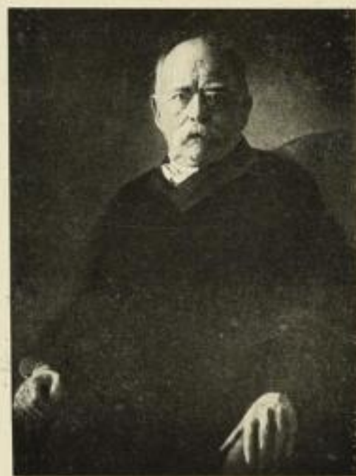
Otto v. Bismarck