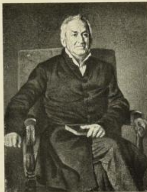
Ernst Moritz Arndt

Vernichtung durch den 30jährigen Krieg — Geldgier und Faulheit des Volkes — Der Große Kurfürst — Friedrich Wilhelm I. — Geistiges Erwachen — Leibniz — Klopstock — Joh. Seb. Bach — Lessing — Möser — Gellert — Friedrich der Große — Kant — Humboldt — Herder — Claudius — Schiller — Knechtschaft unter Napoleon — Die ersten Lieber deutscher Freiheit. — Bildnisse der Zeit: Der große Kurfürst — Klopstock — Bach — Lessing nach Graff — Lessing nach Tischbein — Möser — Gellert — Friedrich der Große nach Menzel — Kant — Humboldt — Herder — Claudius — Schiller. — Anlagen: Merian, Treffen am Lech — Flugblatt aus dem 30jährigen Krieg — Bach, Weihnachtsoratorium.