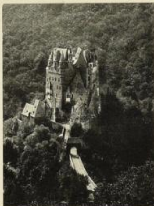
Burg Elz an der Mosel