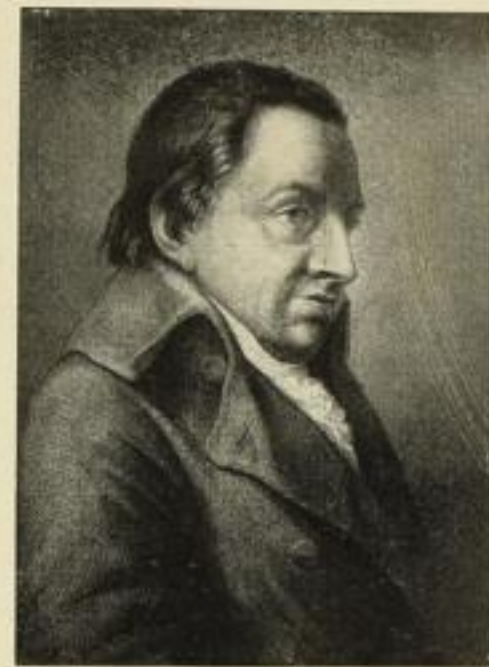
Joh. Gottl. Fichte