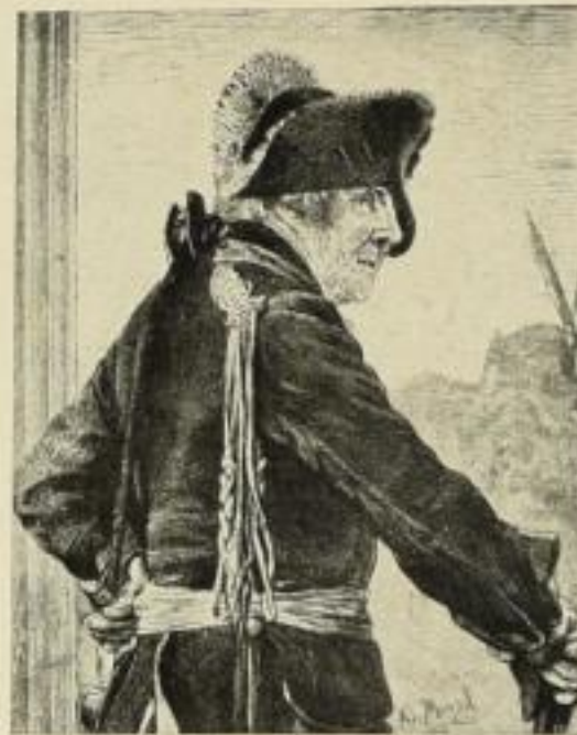
Friedrich der Große