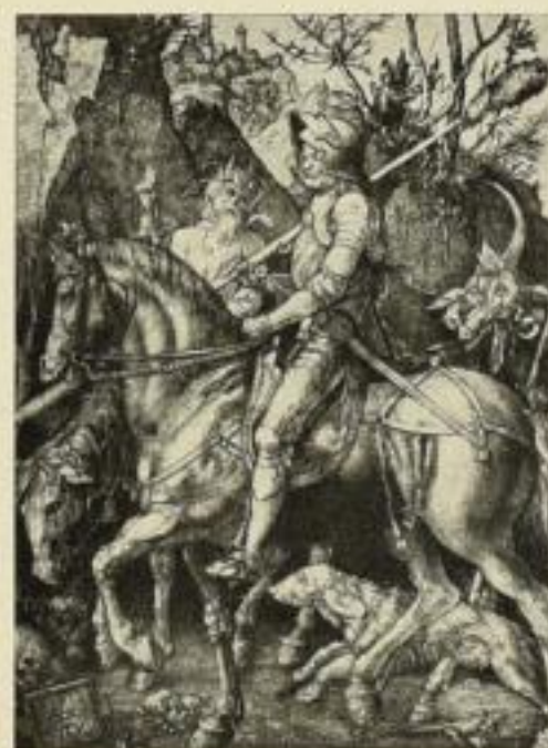
A. Dürer, Ritter, Tod und Teufel

Zu der umseitigen Anzeige des Verlags Hermann A. Wichmann in München über „Deutsche Freiheit“