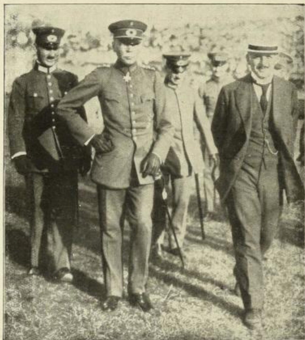
Reichswehrminister und Chef der Heeresleitung

von Generallt. a. D. M. Schwarte , unter gütiger Unterstützung der gesamten Wehrmacht und mit Erlaubnis des Reichswehrministeriums.