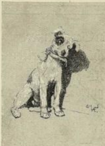
„Der Engel im Hause“