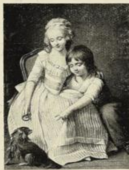
„Kinderbilder aller Zeit“