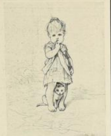
„Kinder und Käuze“