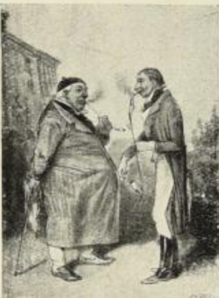
„Aus Großvaters Tagen“