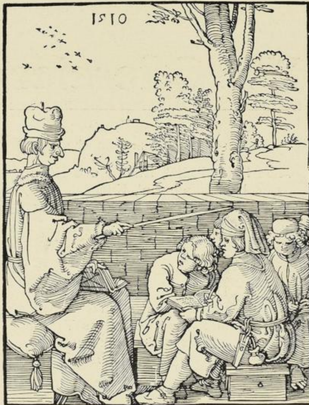
829. Albrecht Dürer: Der Schulmeister, Holzschnitt. 2.—

„Wenn nichts mehr verkauft wird, die Reichsdrucke gehen immer“, äußerte unlängst ein Sortimentler. Gerade vor der ruhigen Sommerszeit sollten Sie deshalb jetzt Ihr Lager reichlich mit Reichsdrucken versehen. Ein Reichsdruck ist ein Geschenk für jede Gelegenheit und von Sammlern hochbegehrt. Ziehen Sie sich einen Stamm von Reichsdrucksammlern heran; wer Reichsdrucke kauft, ist auch für ein gutes Buch zu haben