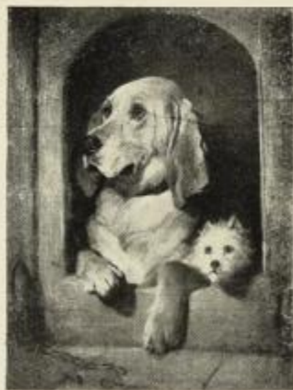
„Hund und Kaß“