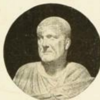
Maximinus (Kaiser germanischer Abstammung)