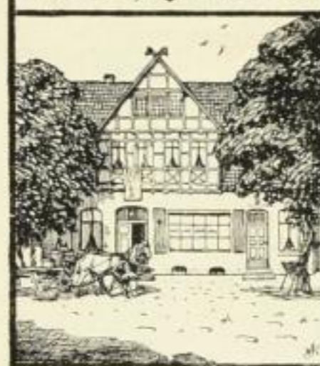
Friedrich Gersbach Verlag, Bad Pyrmont, Hannover