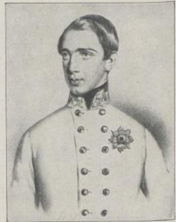
Erzherzog Ferdinand Max von Oesterreich † als Kaiser von Mexiko

Nur zwei Perioden aus dem Leben dieser wahrhaft vornehmen Frau seien an dieser Stelle erwähnt: die Tanzstunden mit dem jungen Kaiser Franz Joseph und seinem Bruder um 1850, das lebensprühende, originelle Wien jener Tage — die langjährige Freundschaft mit dem greisen Kaiser Wilhelm, von der zahlreiche Privatbriefe des alten Herrn Zeugnis ablegen. — Die Erinnerungen