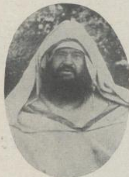
Raisuli, Sultan der Berge (Bildauschnitt)