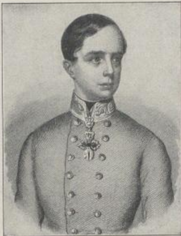
Kaiser Franz Joseph I. von Oesterreich (Kurz nach der Thronbesteigung)

Auf holzfreies Papier gedruckt, mit zahlreichen Abbildungen der Persönlichkeiten, mit denen die Verfasserin in ihrem reichen Leben in Berührung gekommen ist, mit dem Faksimile eines Briefes und eigenhändigen Umschlages Kaiser Wilhelms I., mehreren vierfarbigen Offsetbildern nach Porträts und Seestücken der als Künstlerin bedeutenden Frau, in Ganzleinenband Mk. 7.50.