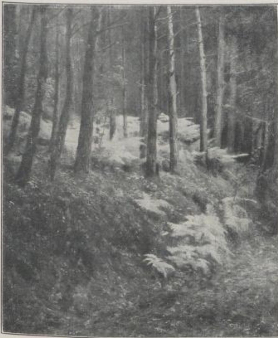
Harren im Herbstwald