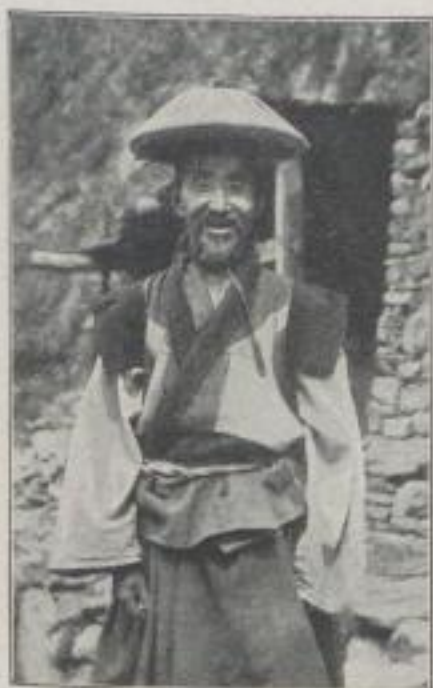
Tibetischer Lama (Verkleinerte Bildprobe)