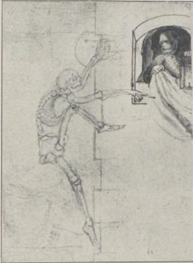
Jugendkomposition Wilhelms zu Goethes Ballade: „Der Totentanz.“

„Es rückt sich von Schnörkel zu Schnörkel hinan, langbeinigen Spinnen vergleichbar.“