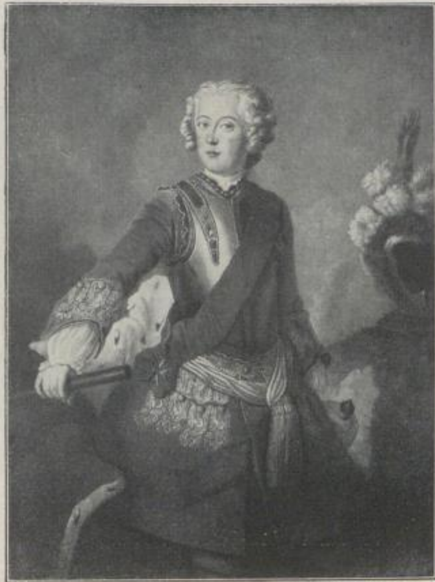
Kronprinz Friedrich nach einem Gemälde von Pesne

Ein umfangreicher, vornehm ausgestatteter Band von 500 Seiten mit 18 Bildtafeln in Ganz- leinenband mit Goldaufdruck 15 Mark Halblederband 22 Mark