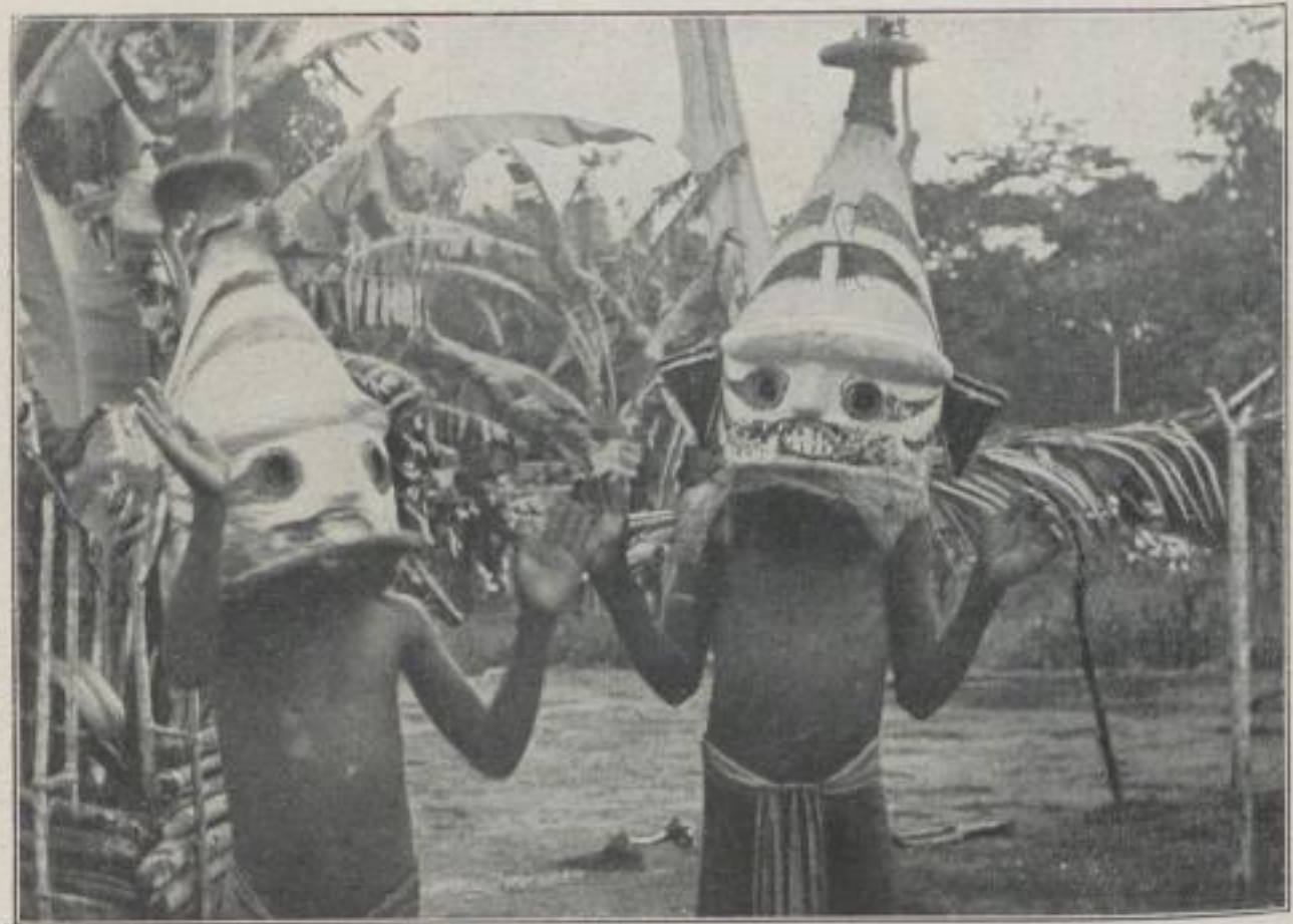
Knaben mit Masken (Buku-Salomon-Inseln.)