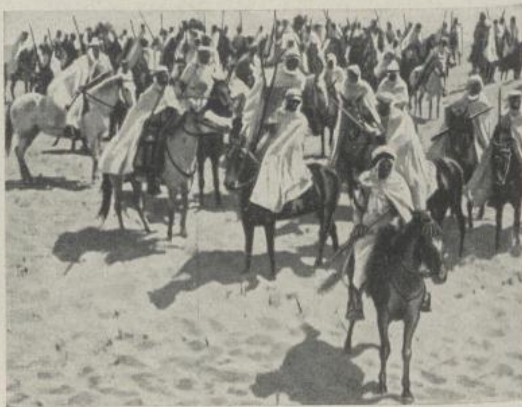
Aus den Kämpfen in Marokko. (Verkleinerte Bildprobe)