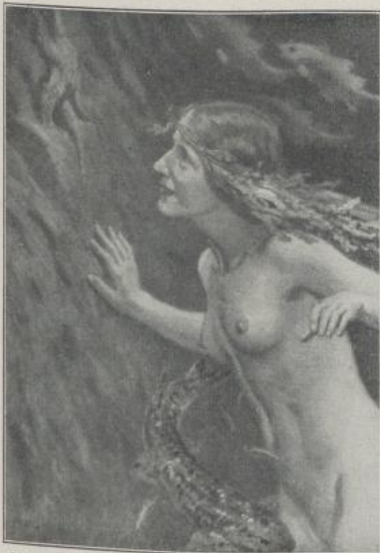
Kinder der Tiefe: Nixenorakel