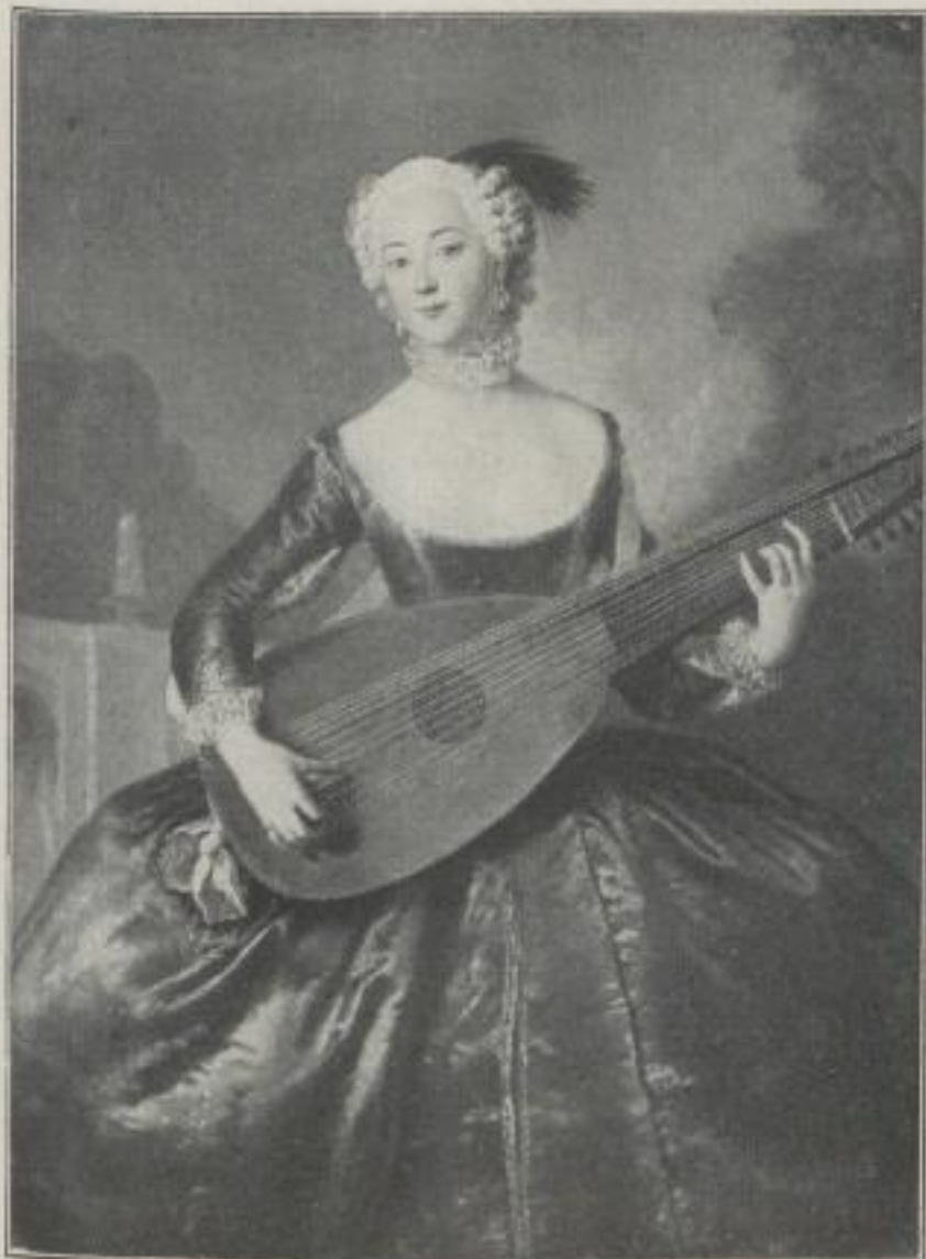
Prinzessin Wilhelmine nach einem Gemälde von Pesne

Erstveröffentlichung von authentischem Material über die Jugend des großen Königs, Einblicke in das Familiendrama am preussischen Königshof, in dem Friedrich Wilhelm I. und sein Sohn die großen Gegenspieler sind, in dem auch der Mutter und Liebingschwester bedeutende Rollen zukommen. Bisher sind diese Verhältnisse nur durch einige wenige Korrespondenzen mit dem Vater und mit Grumbkow bekannt, sowie durch die stark angezweifelte Erinnerung der Markgräfin von Baireuth, während das wahre Denken und Fühlen erst in diesem intimen Briefwechsel der Nachwelt enthüllt wird. Er bildet gleichsam die Grundlage für die Charakterentwicklung Friedrichs des Großen, der in dieser harten Schule zum Manne gereift ist.