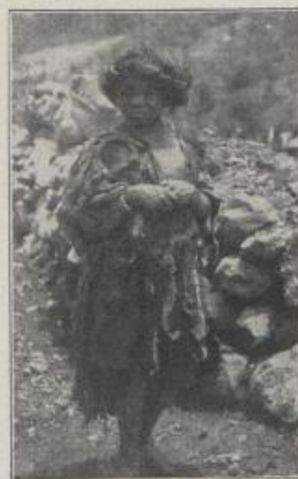
Tibetische Zwergin (Verkleinerte Bildprobe)

Tagebuch der deutschen Expedition Stöckner 1914