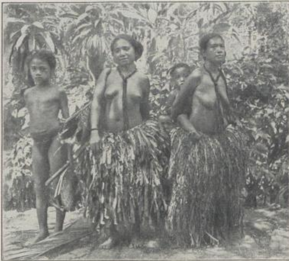
Frauen von Yap