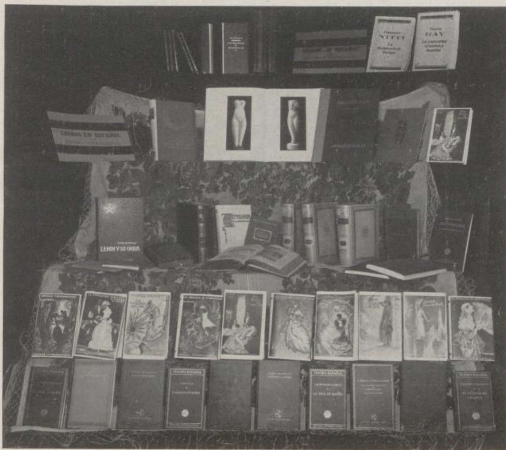
Ausstellung unserer Bücher in einer Berliner Buchhandlung.

EDITORIA INTERNACIONAL BERLIN W 15 / KURFÜRSTENDAMM 220