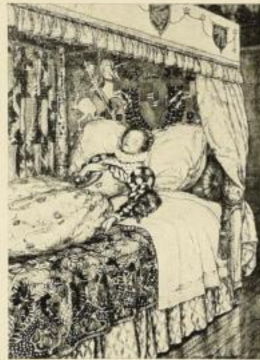
Dickens Weihnachtsabend mit 12 Rackhambildern