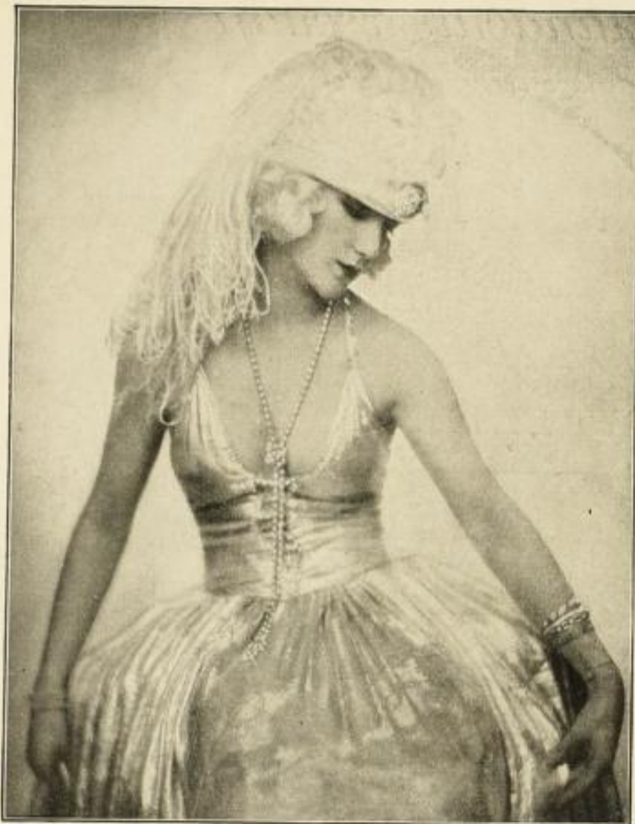
Probekbild aus „Noch und Noch“