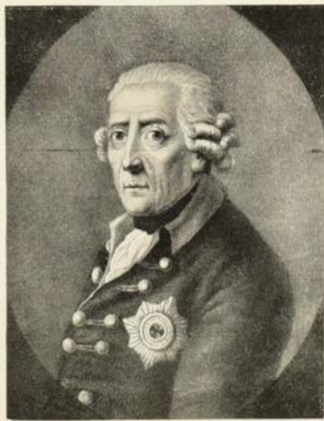
Kupferätzung nach C. Townley Bildgröße 33:25 cm 7.50 M.