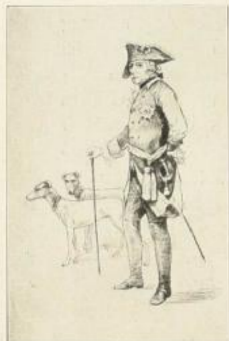
Orig.-Radierung v. W. Scheuermann Bildgröße 23,5:15,5 cm Sign. Druck auf Bütten 5.— M.