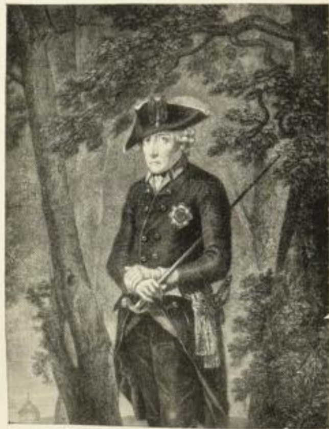
Kupferätzung nach Cuningham Bildgröße 37:27 cm 9.— M.