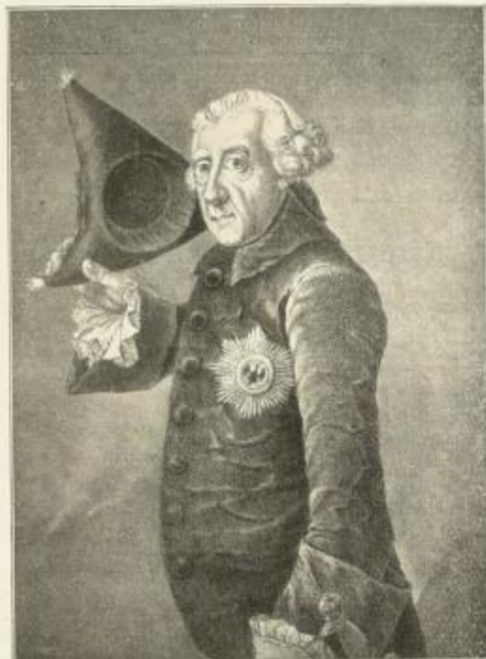
Kupferätzung nach dem gleichzeit. Stich von J. F. Bause Bildgröße 28,5:20 cm 5.— M.