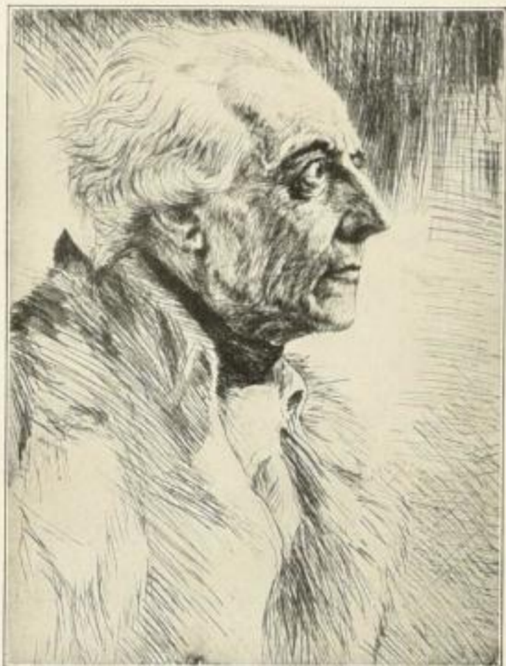
Karl Bauer, Friedrich II. Original-Radierung Bildgröße 32:24 cm Sign. Druck auf Bütten 12.— M.

ADALBERT ROEPER / KUNSTVERLAG / BERLIN-FRIEDENAU