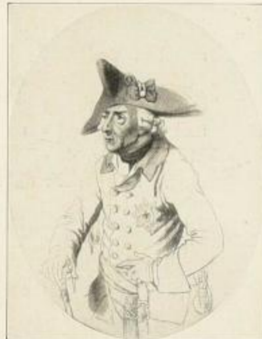
Leicht getönte Kupferätzung nach der gleichzeitigen Zeichnung von J. H. Ramberg bildgröße 21:16,5 cm 4.50 M.