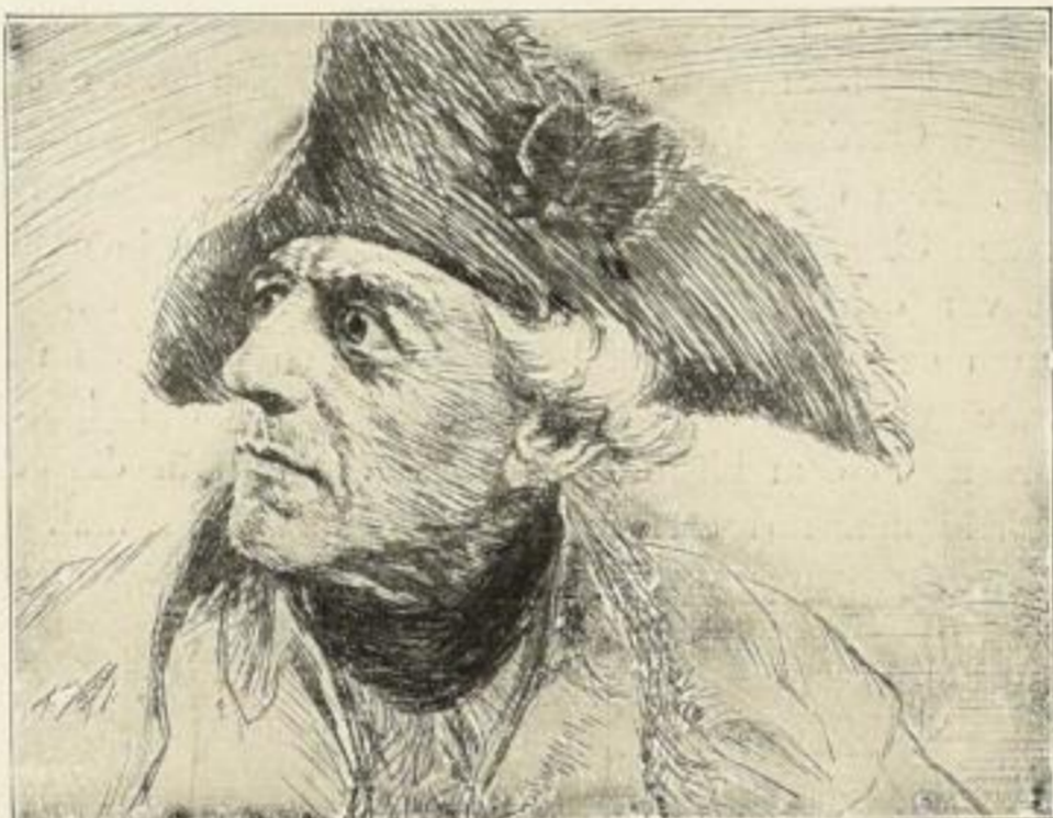
Karl Bauer, Potsdam Original-Radierung Bildgröße 24:32 cm Sign. Druck auf Bütten 12.— M.