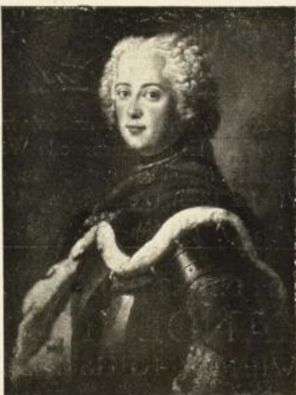
Kupferätzung nach A. Pesne Bildgröße 58:45 cm. 9.— M. Folio 3.— M. Farbige (Faksimile) Gravüre 20.— M. Folio 7.50 M.