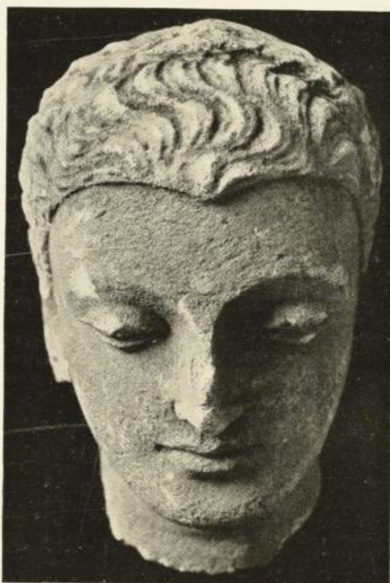
Buddhakopf aus Gandhara. Etwa 2. Jahrh. n. Chr.

Gr.-8 o . 116 Seiten, 48 Tafeln. Holzfrees Papier Kartoniert M. 5.50; Halbleinen M. 7.—