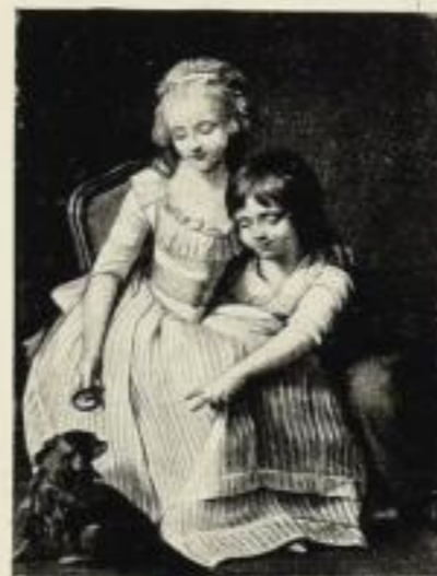
„Kinderbilder alter Zeit“