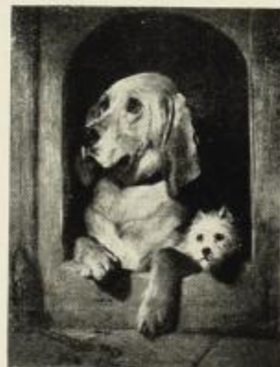
„Hund und Katz“