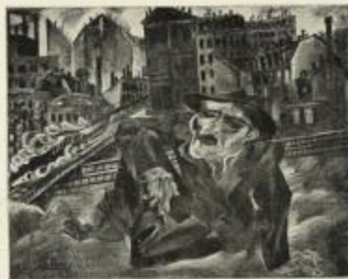
FELIX MÜLLER. STADTMENSCH

In dieser neuen Darstellung erscheint grundlegend für das Verständnis der Kunst des 19. Jahrhunderts die Entwicklung des Naturgefühls, einer dem Malerischen fernstehenden, auf einer durch und durch menschlichen Teilnahme an der Natur beruhenden Versenkung in alles Lebendige um uns. So wird die deutsche Malerei von dem Entstehen des Naturgefühls im ausgehenden 18. und beginnenden 19. Jahrhundert verfolgt, bis zuletzt die künstlerische Sprache als Ausdruck des Künstlers mehr und mehr eine Eigenbedeutung gewinnt und den der Natur abgesehen Oberflächenreizen des Impressionismus die in Farbe und Form von der Natur unabhängigen Konstruktionen des Kubismus folgen.