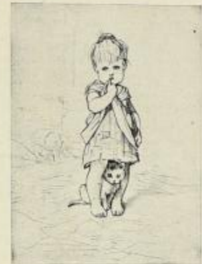
„Kinder und Käuze“