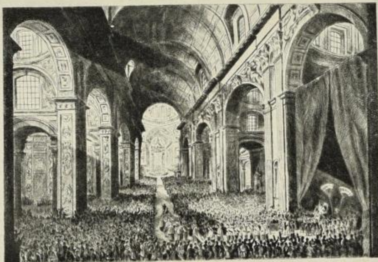
PIUS XI PONT. MAX. IN BASILICA S. PETRI ANNO SANCTO MCMXXV

Die kleine Abbildung kann selbstverständlich nicht annähernd die großartige Wirkung der Radierung wiedergeben. Die Radierung wird allgemeines Interesse haben und auch Sammlerwert.