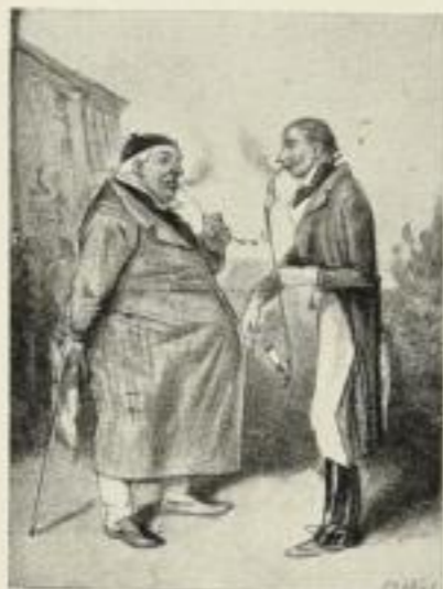
„Aus Großvaters Tagen“