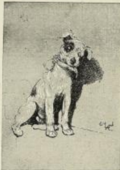
„Der Engel im Hause“