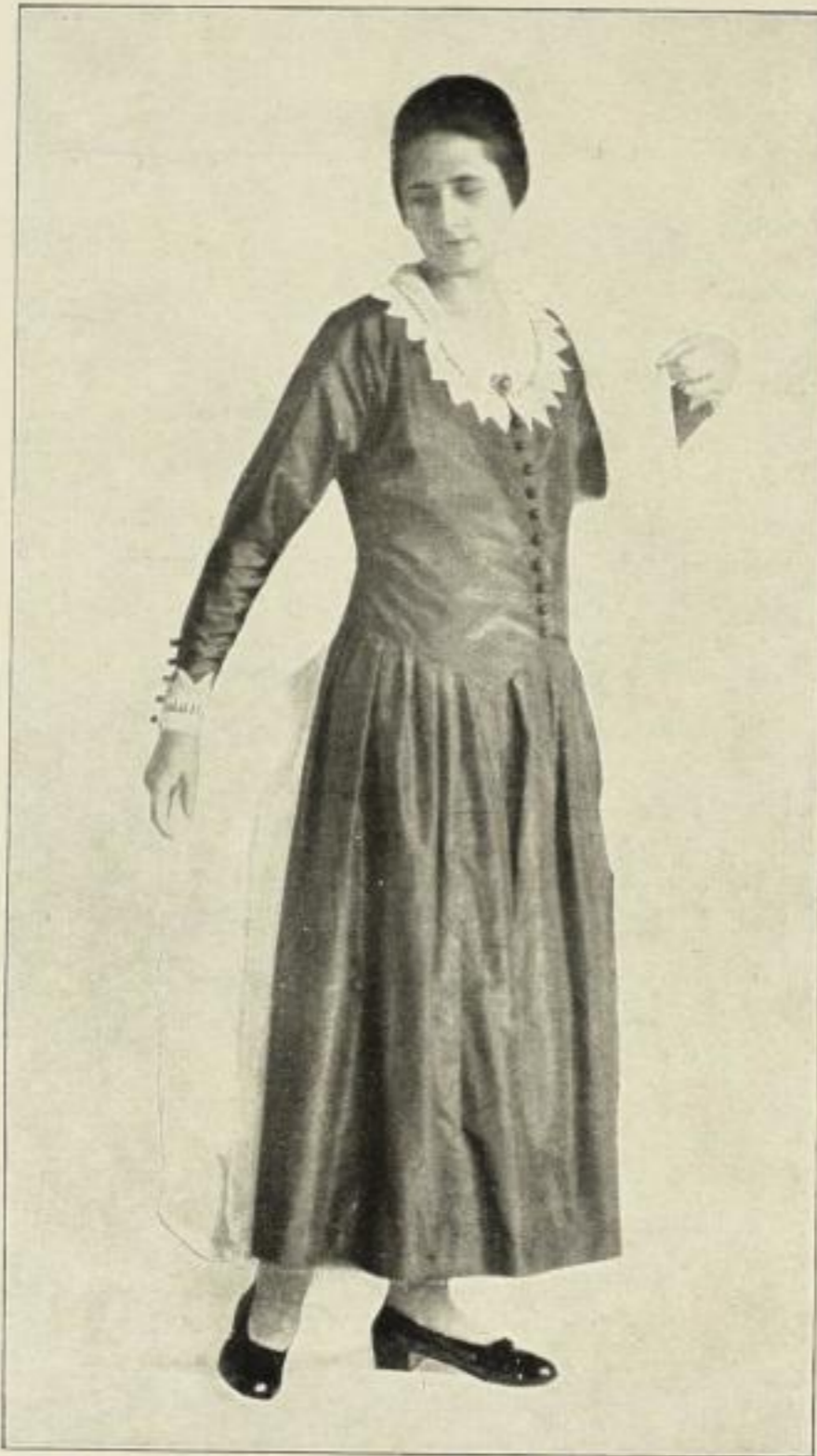
Schwarzes Taftkleid, auch für ältere Damen geeignet. Aus DFF Nr. 1/1925.