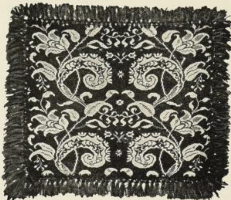
Tulpenkissen. Dithmarscher Museumswerkstätten, Meldorf. Aus DFF Nr. 6/1924.

Preis pro Heft nur M. 1.— mit allen Beilagen.