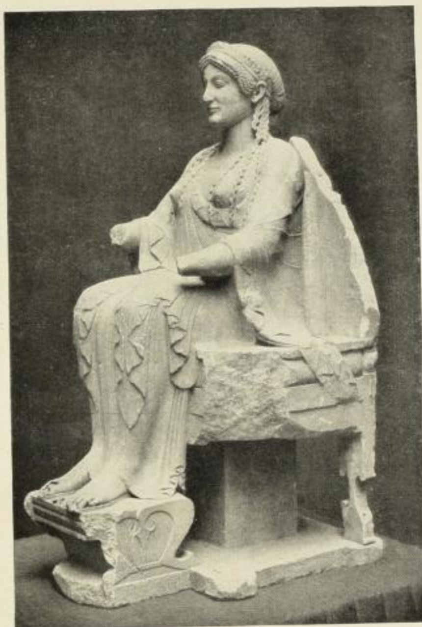
Thronende Göttin Marmor. Um 480 v. Chr. Berlin, Staatl. Museen H. 1,51 m