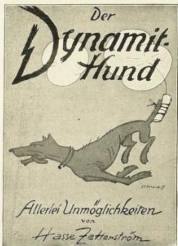
Der Dynamithund 38. Tausend

Als leichtverkäufliche Schaufensterartikel haben sich mit ihren zugkräftigen bunten Umschlagbildern erwiesen: