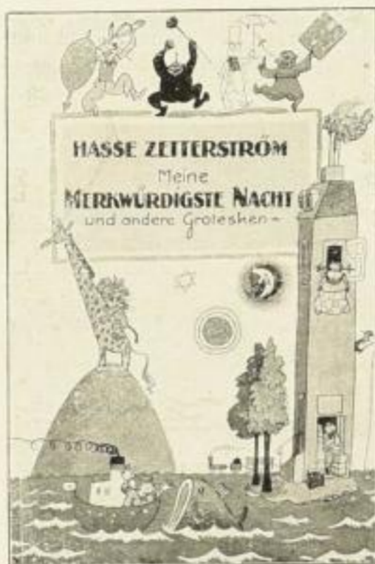
Meine merkwürdigste Nacht 24. Tausend