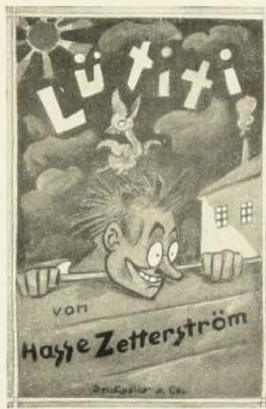
Lütiti 14. Tausend