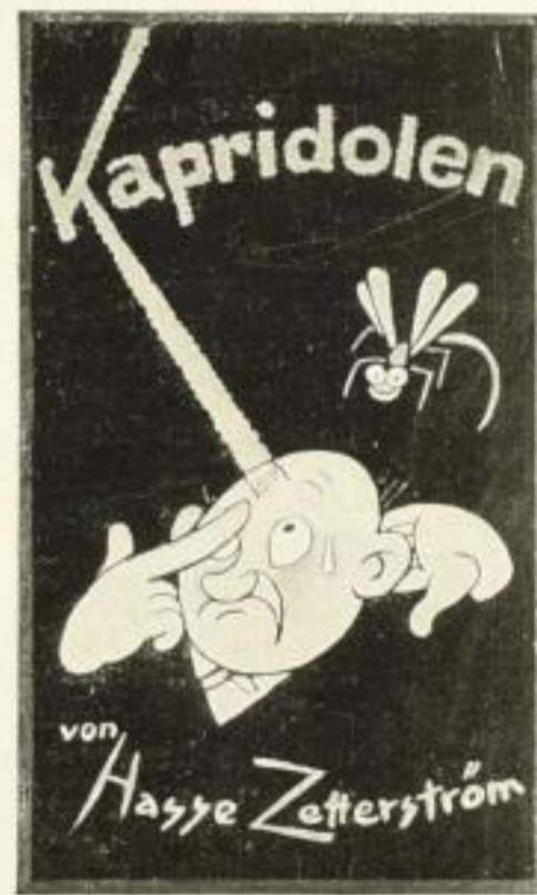
Kapridolen 6. Tausend