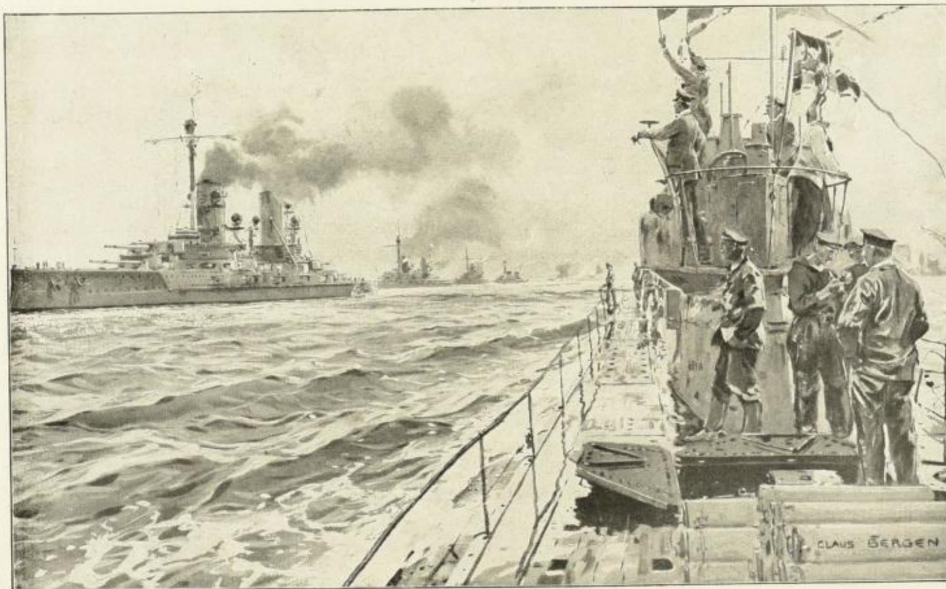
Winkspruch an die deutschen Großkampfschiffe bei der Heimkehr

Das reichillustrierte Buch kostet in Ganzleinenband 9 Mark