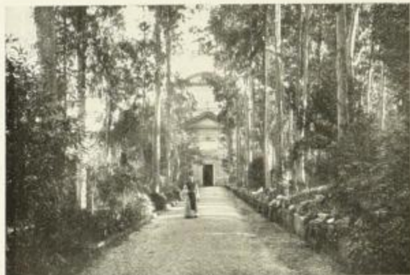
Abtei Tre Fontane bei Rom