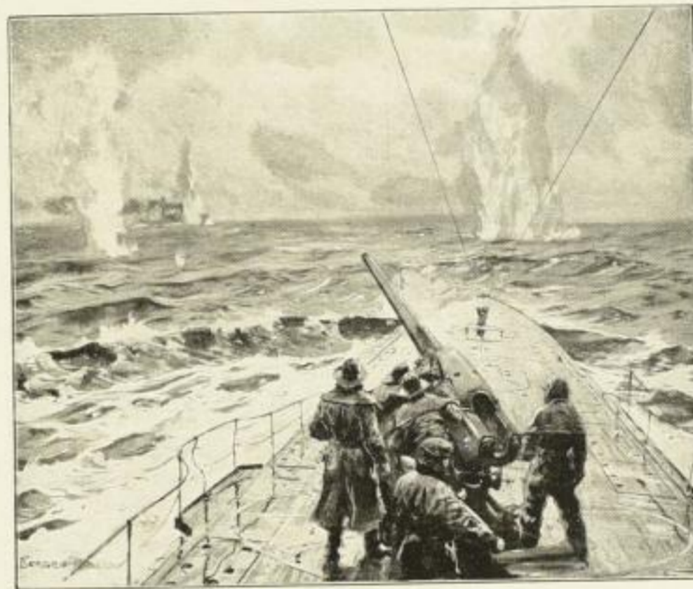
Gefecht mit dem Briten