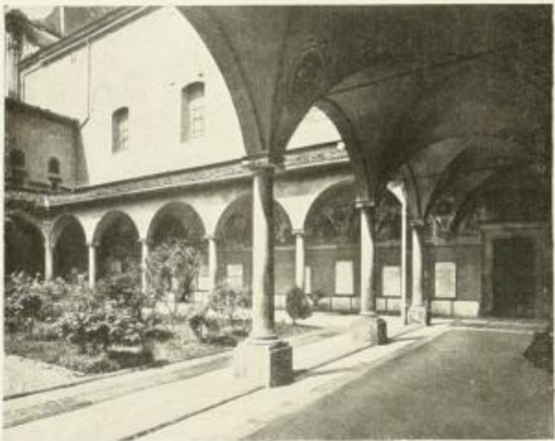
Kreuzgang in S. Marco in Florenz

Gr. Oktav, 270 Seiten auf Kunstdruckpapier. Fünf Bildbeilagen und 155 Abbildungen im Text. Gebunden in Ganz-Leinwand M. 12.—.