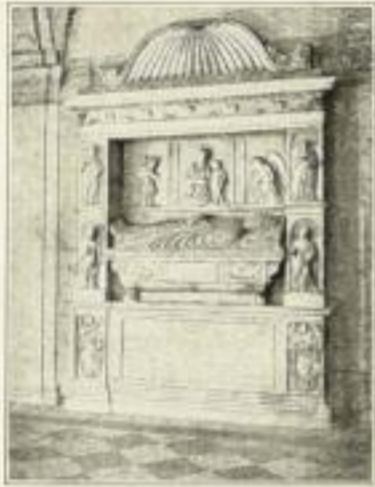
Eugen IV. (Rom)