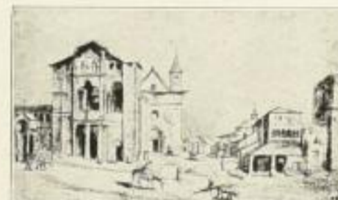
Der alte Lateran