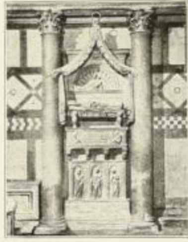
Johann XXIII. (Florenz)