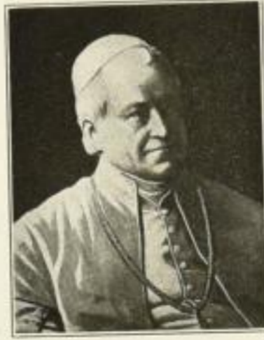
Pius IX. (Aigner)