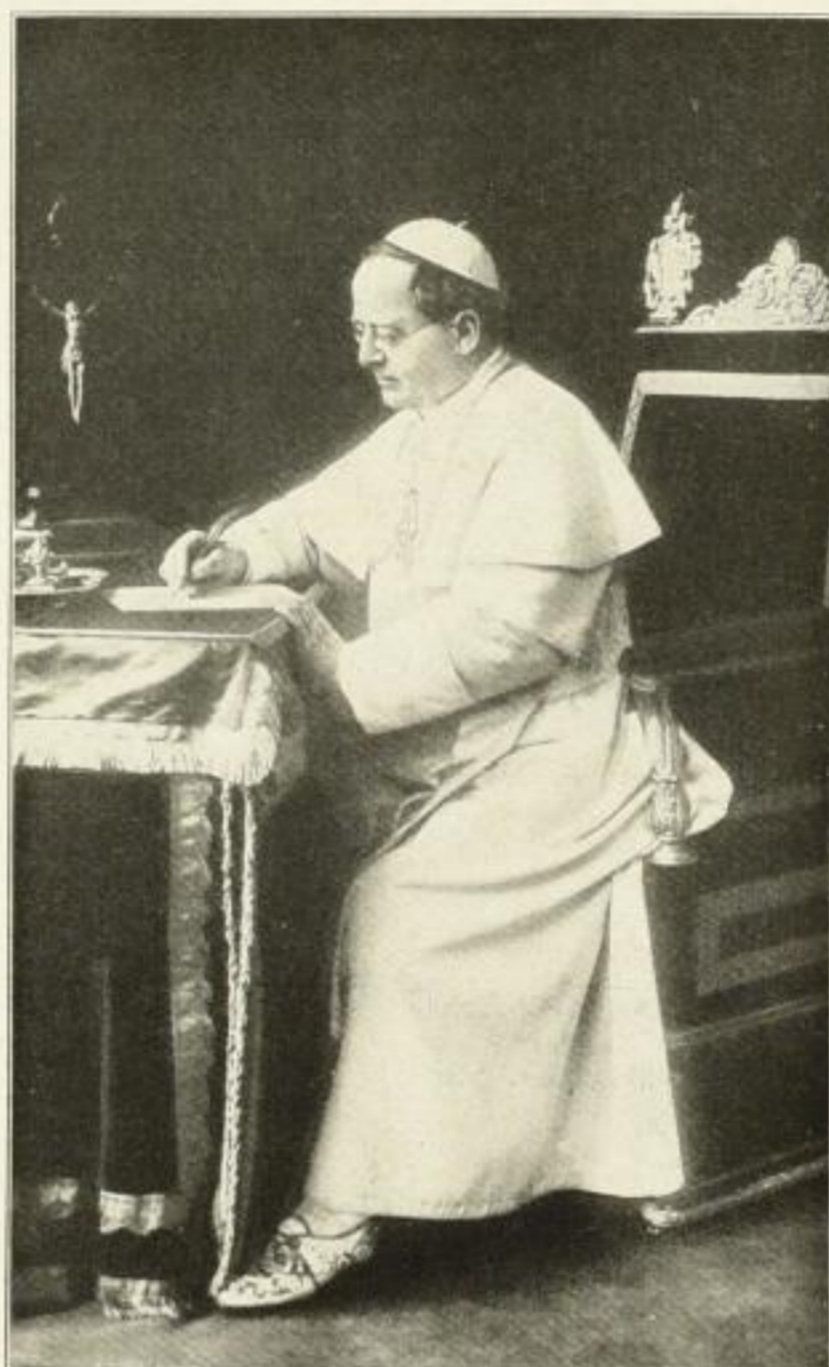
Das Bild des jetzigen Papstes Pius XI.

in sorgfältigster Ausstattung, überraschend reich und billig