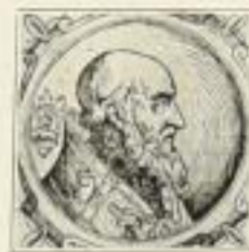
Marcellus II. (Holzschnitt)