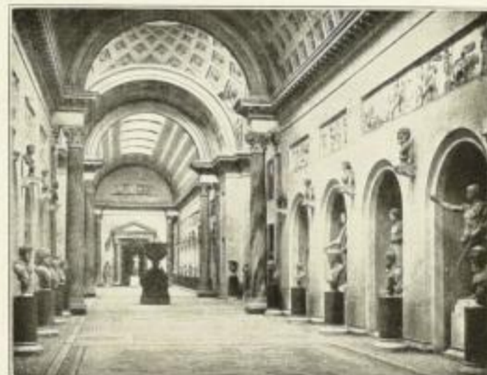
Aus den Museen: Braccio Nuovo