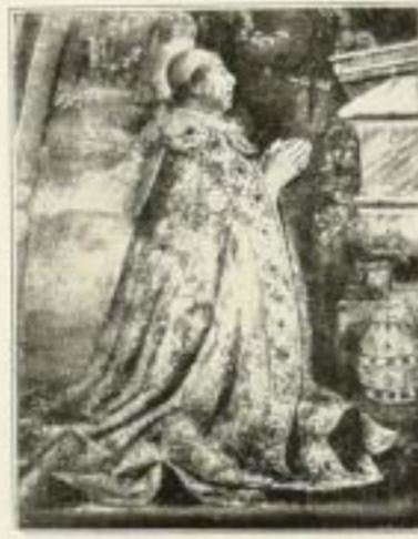
Alexander VI. (Pinturicchio)