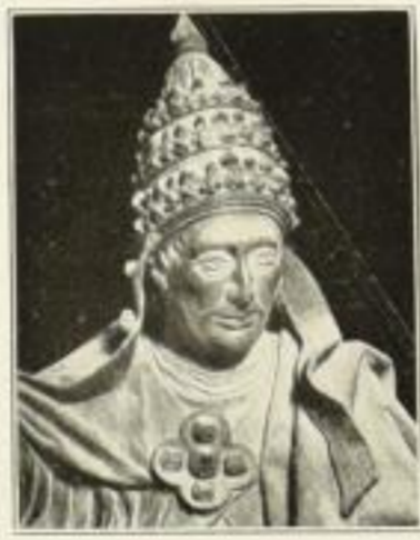
Innocenz VIII. Bronzestatue S. Peterdom