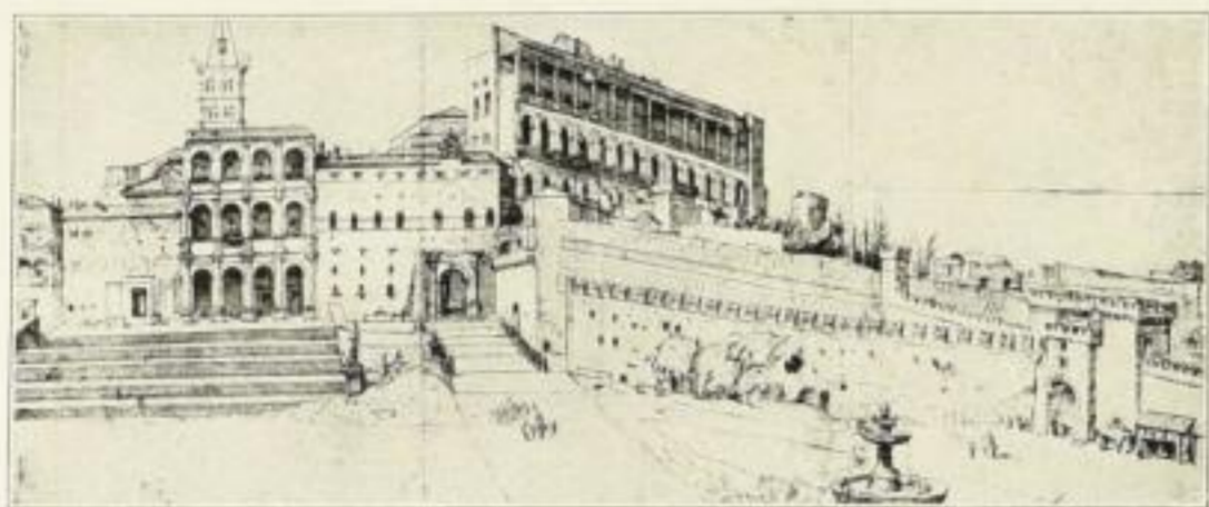
Alt St. Peter und Vatikan

Die verschwundenen Altertümer in den zeitgenössischen Künstlerzeichnungen; die heutigen Anlagen in den besten photographischen Aufnahmen.