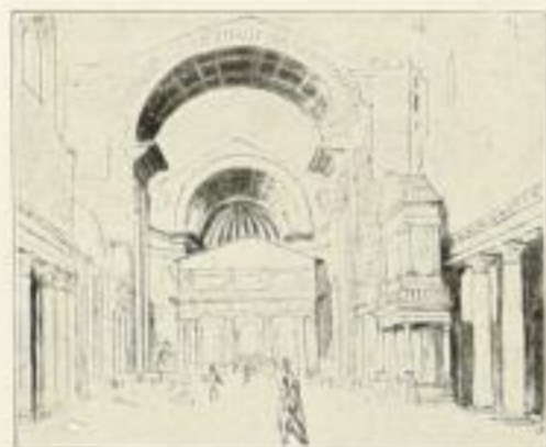
Der Umbau der St. Peterskirche