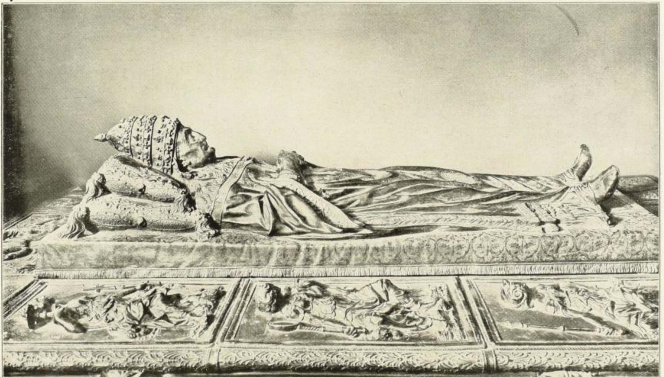
Sixtus IV. (Rom. Museum Petrinum) Bildgröße wie im Buch

Verantw. Redakteur: Richard Albert. — Verlaag: Der Börsenverein der Deutschen Buchhändler zu Leipzig, Deutsches Buchhändlerhaus. Druck: E. Hedrich Nachf. (Abt. Ramm & Seemann). Sämtlich in Leipzig. — Adresse der Redaktion u. Expedition: Leipzig, Gerichtsweg 26 (Buchhändlerhaus).