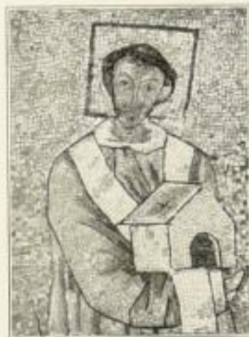
Johann VII. Mosaik i. Vatik. Grotten

Alle Päpste von S. Petrus bis Pius XI., wie sie in der Paulsbasilika in Rom abgebildet sind — außerdem eine erstmalige Papstikonographie, das ist die Sammlung aller Papstbildnisse, wie sie in alten Mosaiken und Fresken, in den mittelalterlichen Plastiken, in den Meisterwerken der klassischen Zeit, in den graphischen Sammelwerken des 16.—18. Jahrhunderts und in jüngeren Darstellungen und Denkmälern uns erhalten sind. Nachstehende Abbildungen ein Drittel der Originalgröße im Buch.