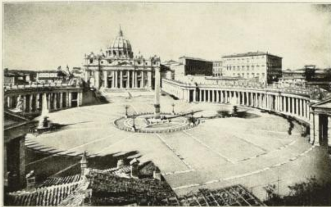
Der heutige Petersplatz