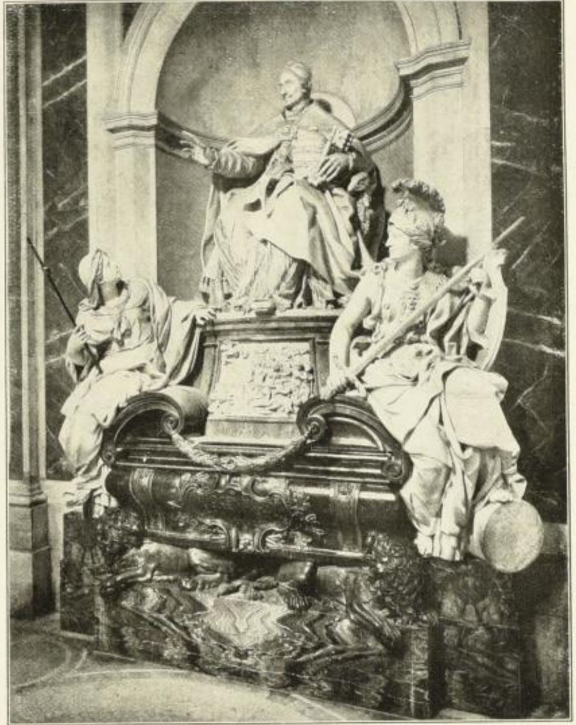
Innocenz XI. (Rom) Bildgröße wie im Buch