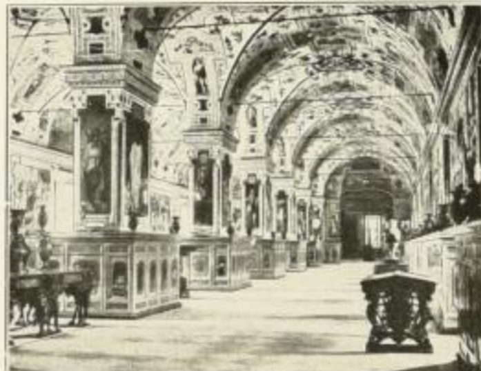
Aus der vatikanischen Bibliothek