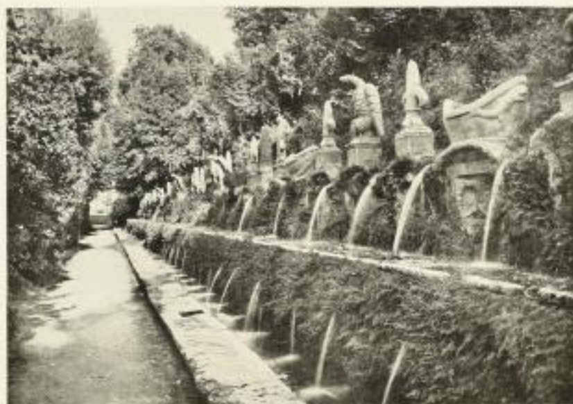
Villa Iuliana, Villa I Tullie, „Le Caselle“ (1607—1620) (verkleinert nach Ricci „Barock in Italien“)