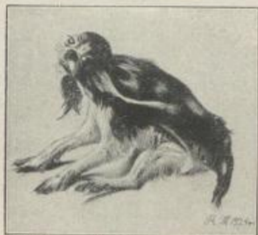
Hündin 12 : 12,5 cm Gm. 10.—

Stellen Sie jetzt unsere Natur und Technik-Bändchen ins Schaufenster