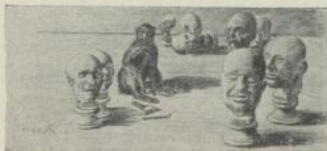
Der Bildhauer 11 : 25 cm Gm. 22.50