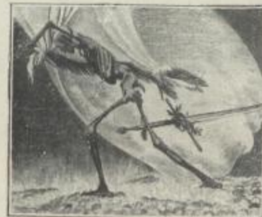
Der ewige Frieden 12 : 14 cm Gm. 15.—