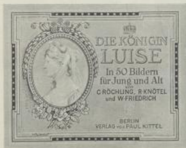
Größe des Werkes 25 x 32 cm