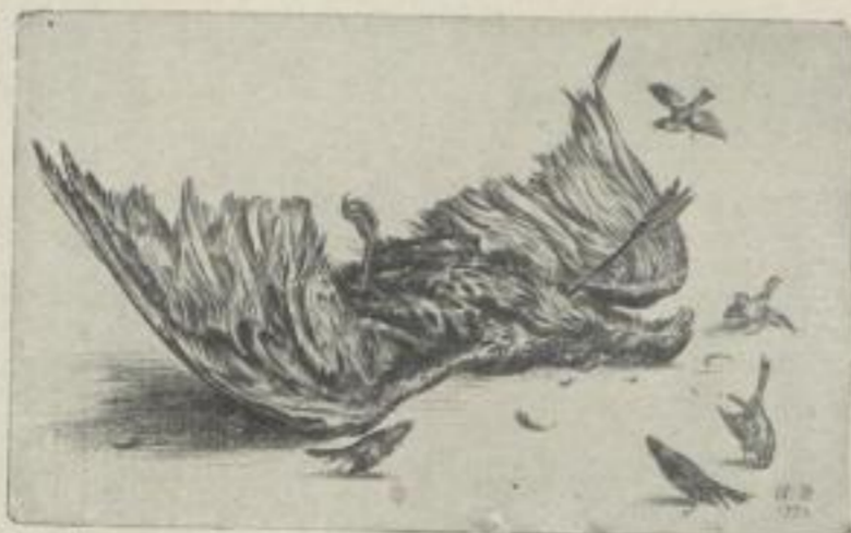
Helden 12 : 29,5 cm Gm. 30.—

Meister als Tierschilderer, Beherrscher der Arabeske und Grotteske