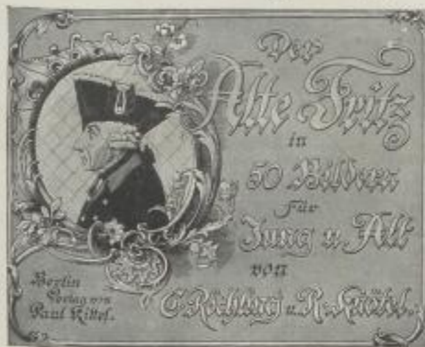
Größe des Werkes 25 x 32 cm

Wie die täglich einlaufenden Bestellungen beweisen, ist die Nachfrage nach diesen beiden klassischen Werken vaterländischer Geschichte noch heute unvermindert stark! Beide Werke erscheinen in vorzüglicher Ausstattung auf holzfreiem Karton in Sechsfarbindruck. Der Preis beträgt für ein Werk in Ganzleinenausführung M. 14,- * Subskriptionspreis 10. Juli M. 10,- * Vorzugsangebot auf beiliegendem Bestellzettel