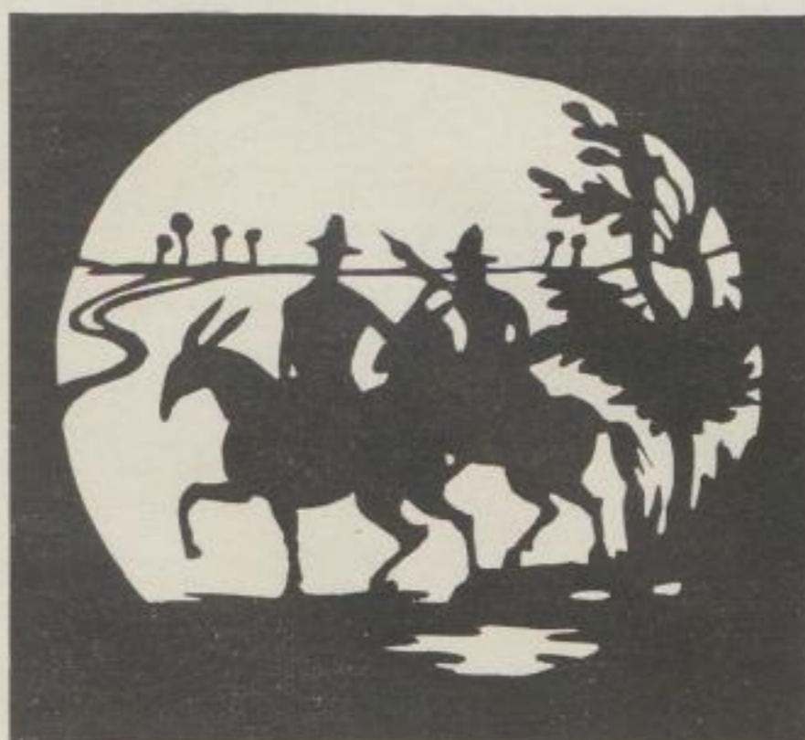
Figuren zum Schattenspiel