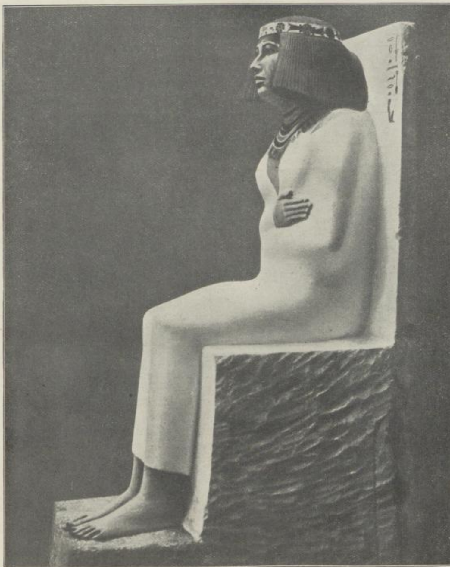
KALKSTEINSTATUE DER NOFRET

HEINRICH SCHÄFER UND WALTER ANDRAE DIE KUNST DES ALTEN ORIENTS AGYPTEN, BABYLONIEN, ASSYRIEN, DIE HETTITER USW.