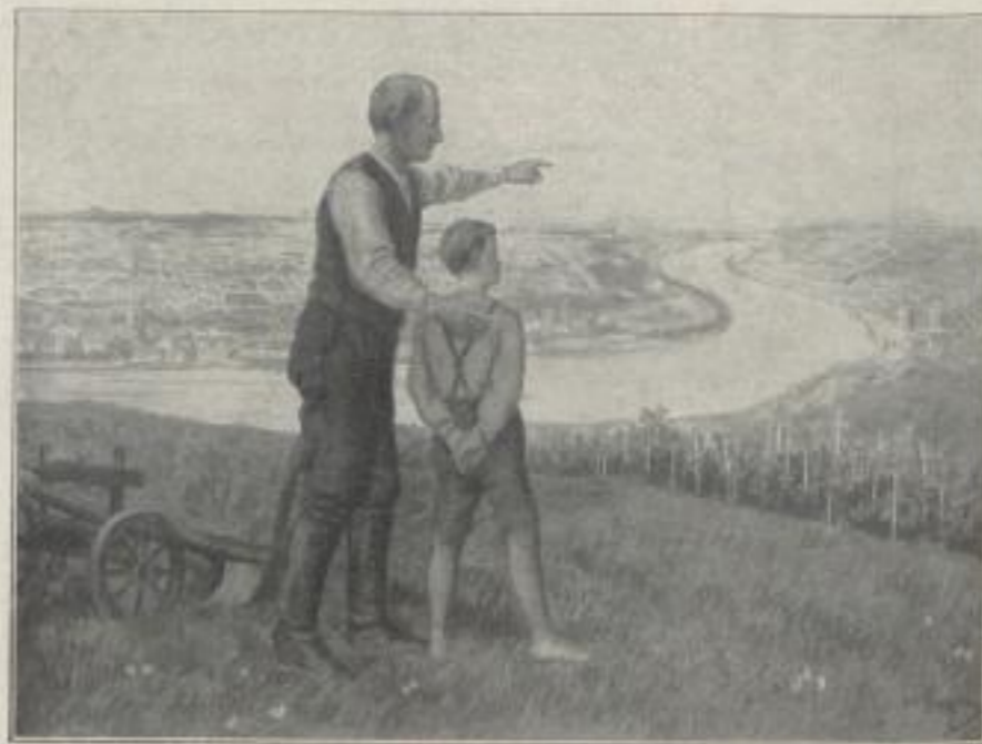
Nr. 79. W. Zirges: „Dies alles ist deutsches Land“ Künstlersteinzeichnung, farbig, 55 x 75 cm, RM. 6.— Ladenpr.