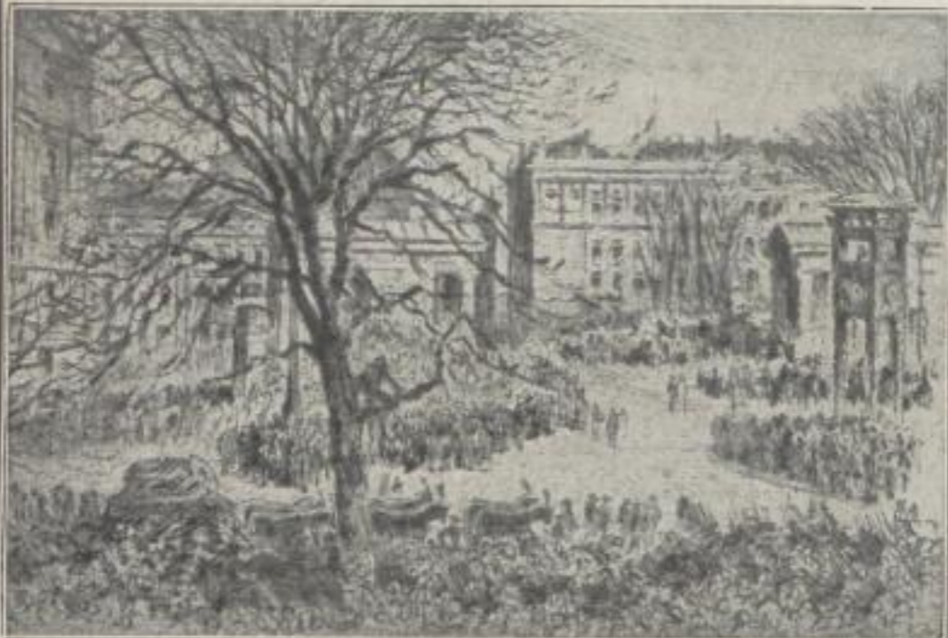
Platte 19,5x31 cm Auf Bütteln (Nr. 1-120) Ladenpreis M. 12.—