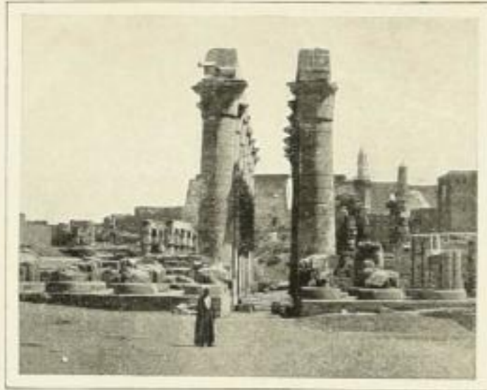
Der große Säulengang des Har-em-heb und Sethos I. im Tempel von Luxor