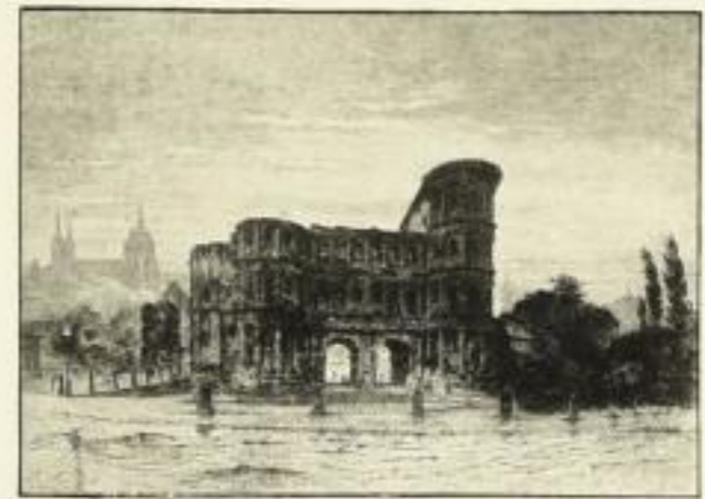
B. Mannfeld, Trier, Porta Nigra

Seben erschienen in der Folge „VOM RHEIN“ in Bildgröße 18:24 cm, Preis M. 2.50