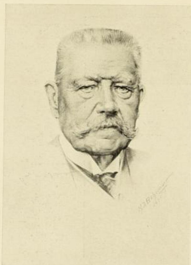
P. K. 405

IN DER REIHENFOLGE MEINER PORTRÄTKOLLEKTION SOEBEN AUSGEGEBEN