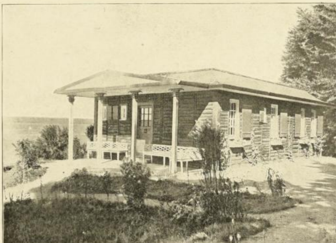
Landhaus (Holzbau) an der Ostsee. Aus DSS. 7.