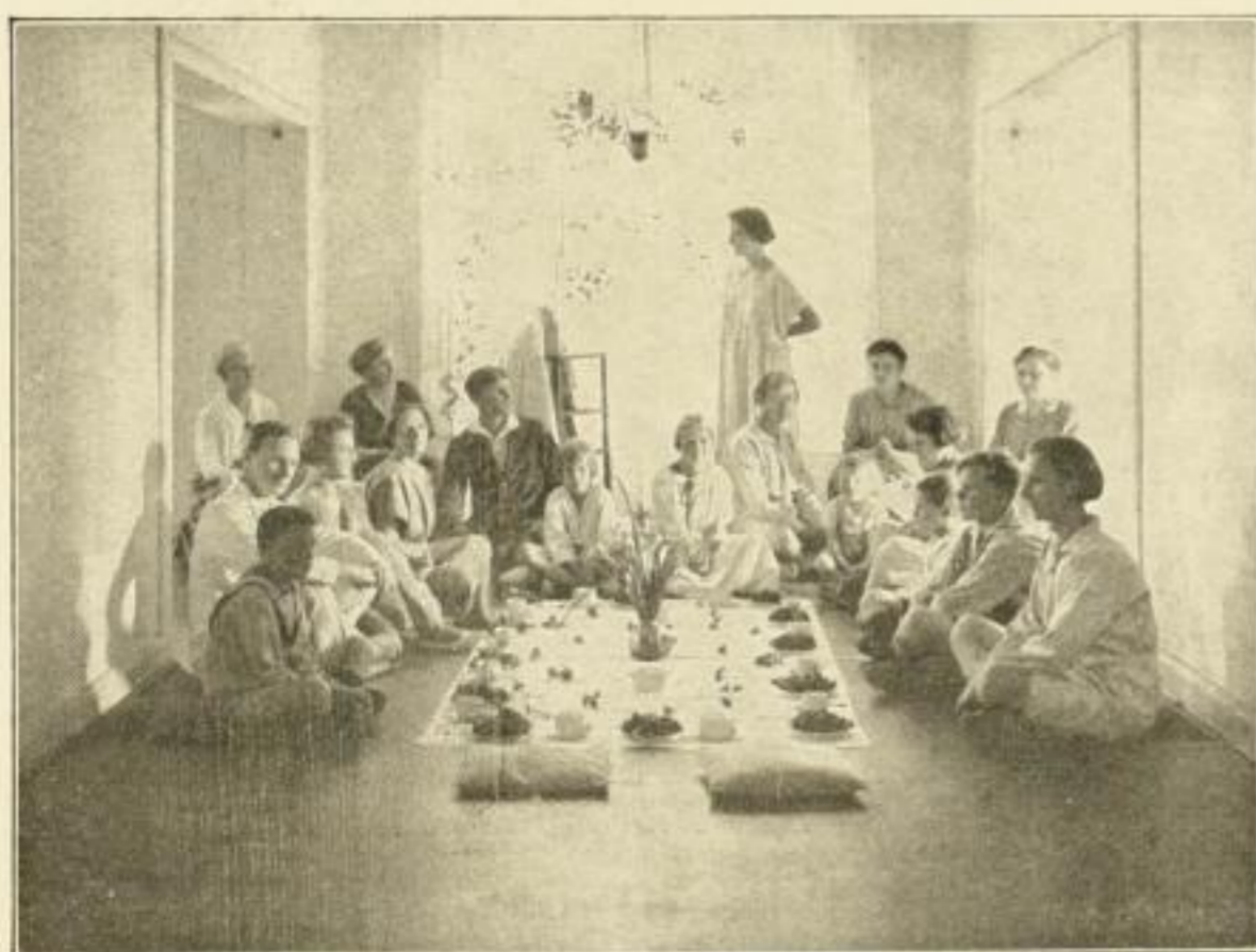
Mahlzeit in der möbelfreien Wohnung. Ein Versuch. Aus DSS.