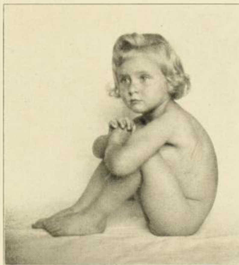
Aus der Serie: Kinderakte II