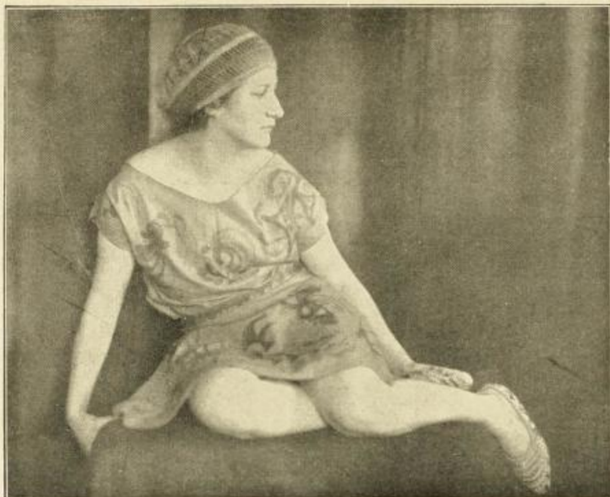
Ein Lustanzug für den Badestrand. Aus DSS. 7.