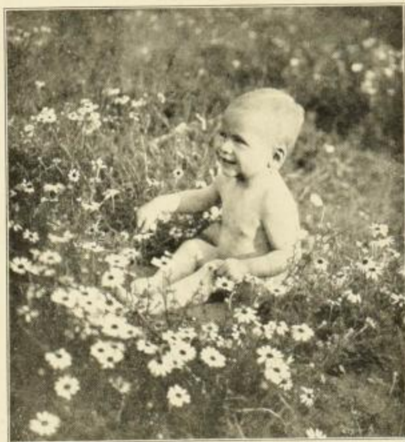
Aus der Serie: Blumenkinder

Auslieferung der Postkarten nur vom Verlagsort.