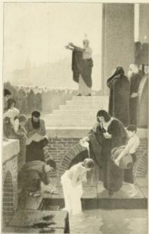
„Königskirche des hl. Petrus“