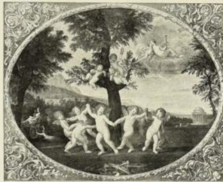
312. Albani: Amorettenanz. 72 x 90 cm. 20.— GM.