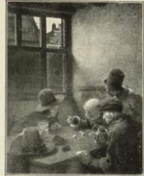
196. Cl. Meyer: Würfler. 51 x 66 cm. 15.— GM.