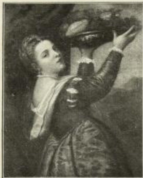
299. Tizian: Lavinia. 56 x 71 cm. 15.— GM.