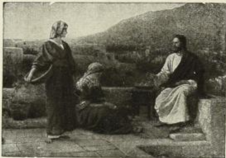
165. Seeger: Jesus bei Maria und Martha Bild 50x71 cm. 15.— GM.