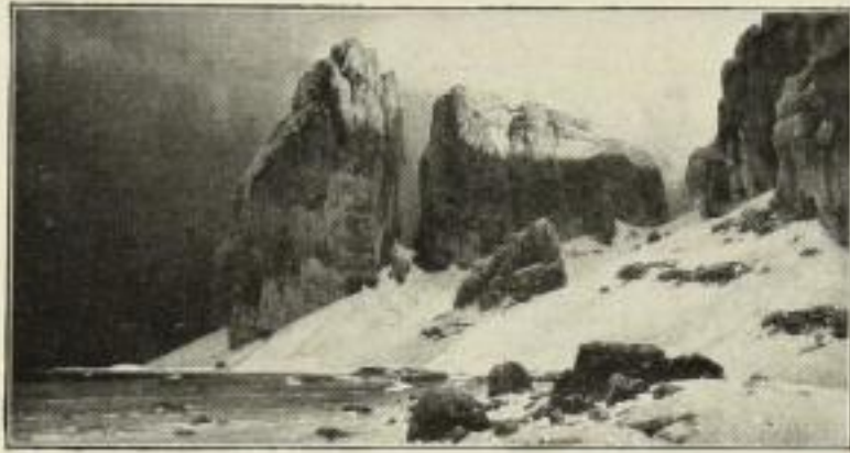
283. Bracht: Gestade der Vergessenheit, 35x68 cm. 15.— GM.

Zur Messe in Leipzig: Stentzler's Hof, Petersstr. 39/41, II. Stock, Raum 208-210