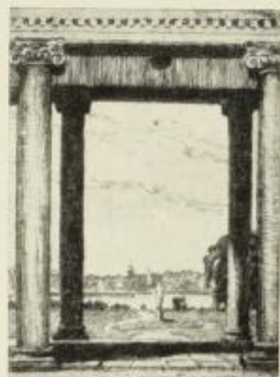
Blick vom Schloßhof auf den Obelisk