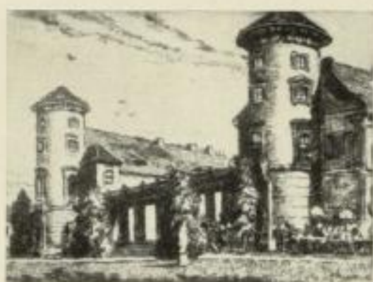
Das Rheinsberger Schloß von der Seeseite