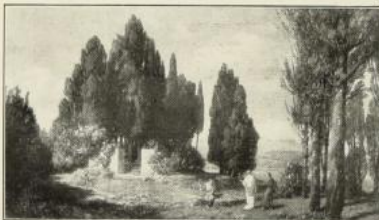
315. Lippisch: In Arkadien. 58 x 104 cm. 20.— GM.