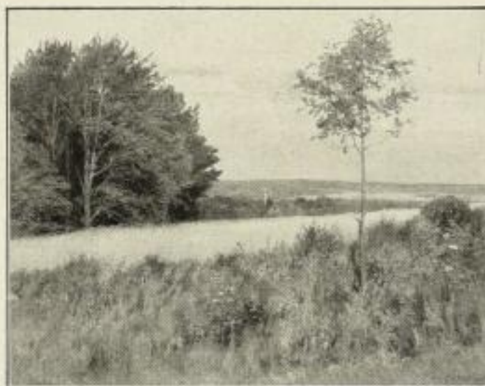
314. Clodius: Sommer. 54 x 69 cm. 15.— GM.]