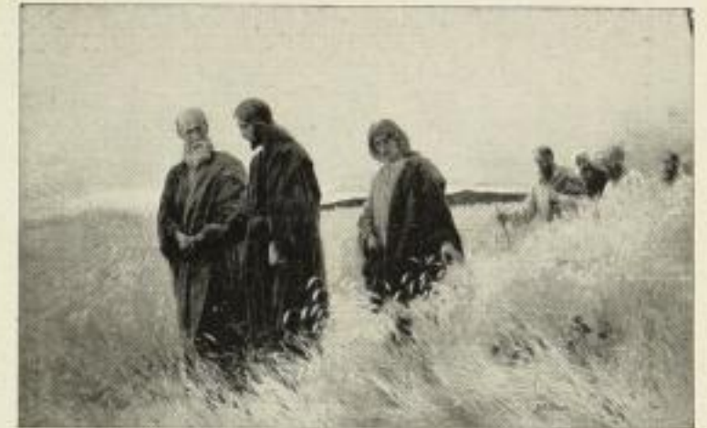
J. R. Wehle: Und sie folgten ihm nach. 137 Bild 47x74 cm. 15.— GM. 137a Bild 34x54 cm. 7.50 GM. 137b Bild 19x31 cm. 3.75 GM.