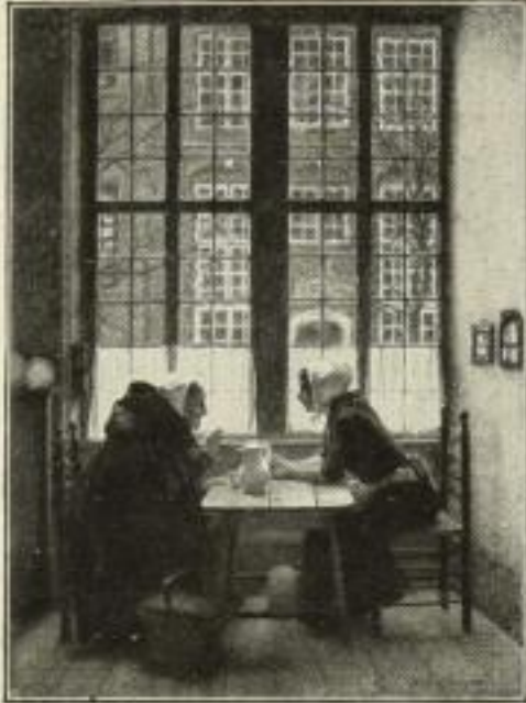
229. Cl. Meyer: Nachbarinnen. 51 x 70 cm. 15.— GM.

RABATT: 50% und 7/6 gemischt! Illustriertes Auswahlverzeichnis kostenlos!