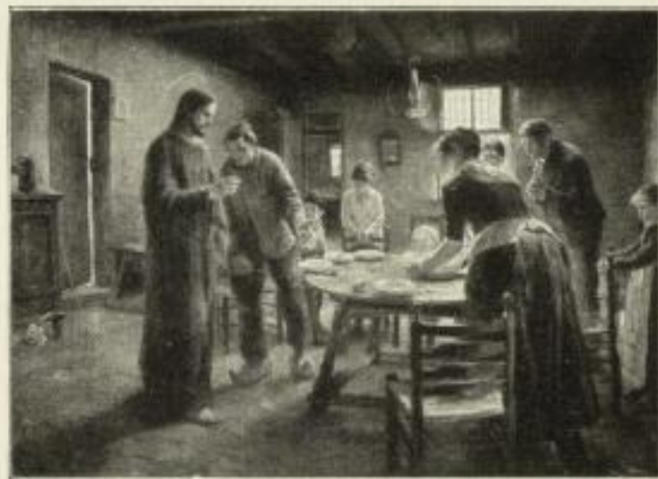
271. v. Uhde: Komm, Herr Jesus, sei unser Gast Bild 50x68 cm. 15.— GM.