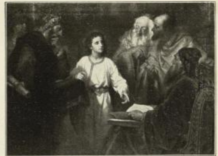
Hofmann: Zwölfjähriger Jesus im Tempel 249 c Bild 70x95 cm. 20.— GM. 249 Bild 50x67 cm. 15.— GM.