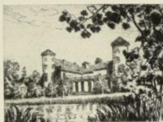
Das Rheinsberger Schloß vom andern Ufer des Sees