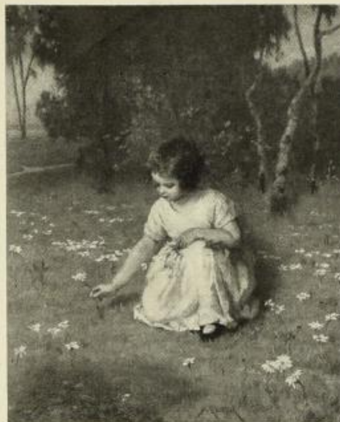
S. Glücklich: Im Maien

Zur Leipziger Messe: Stentzlers Hof , II. Stock, 221 u. 221 a.