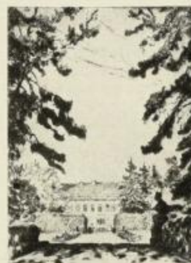
Auf der Sphinxstiege im Park