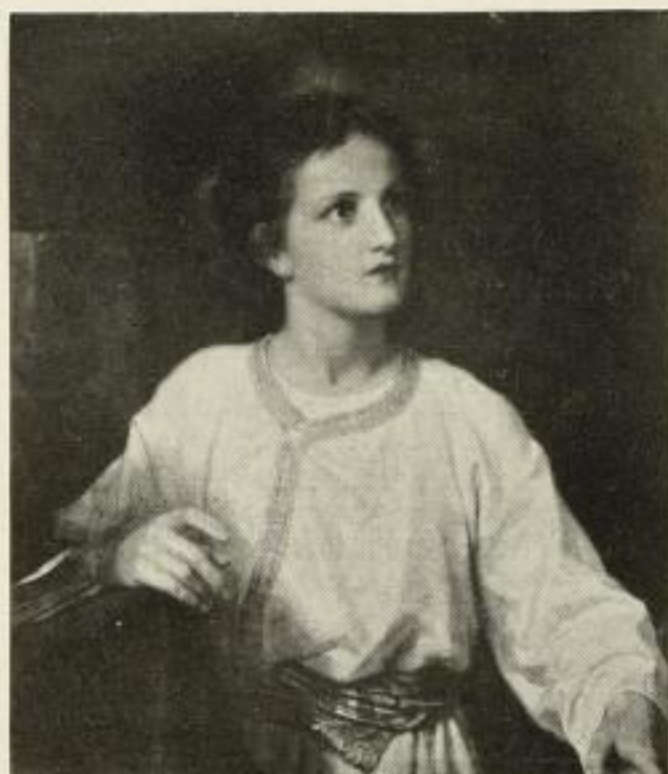
291. Hofmann: Jesusknabe. 58x68 cm. 15.— GM.