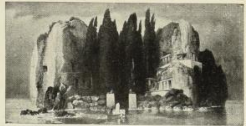
146. Böcklin: Die Insel der Toten, 35x68 cm. 15.— GM.