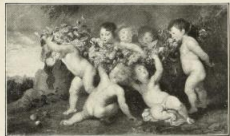
300. Rubens: Früchtekranz. 54 x 94 cm. 20.— GM.