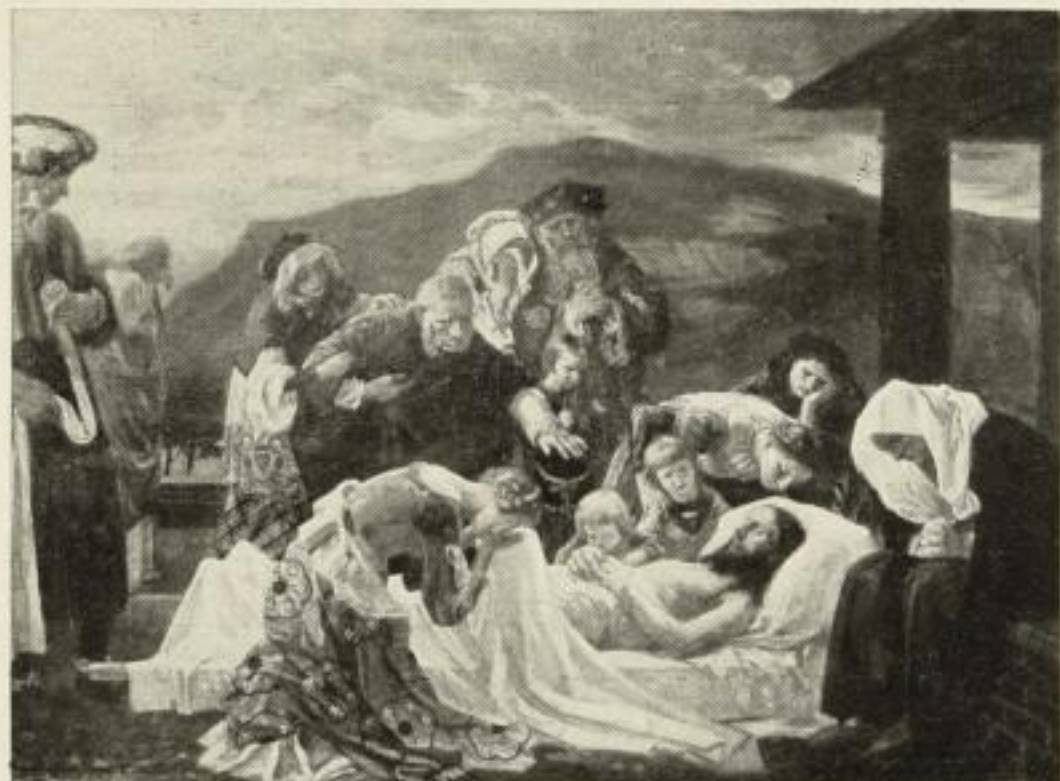
323. Pfannschmidt: Beweinung Christi. 72x96 cm. 20.— GM.