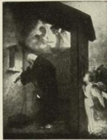
81. Böcklin: Der Eremit Bild 48x63 cm. 15.— GM.