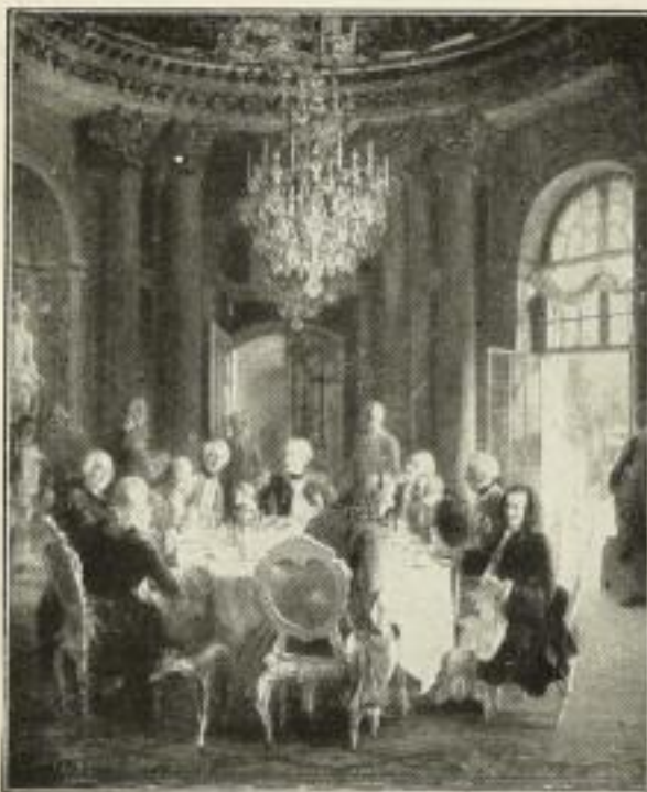
185. v. Menzel: Tafelrunde. 52 x 62 cm. 15.— GM.