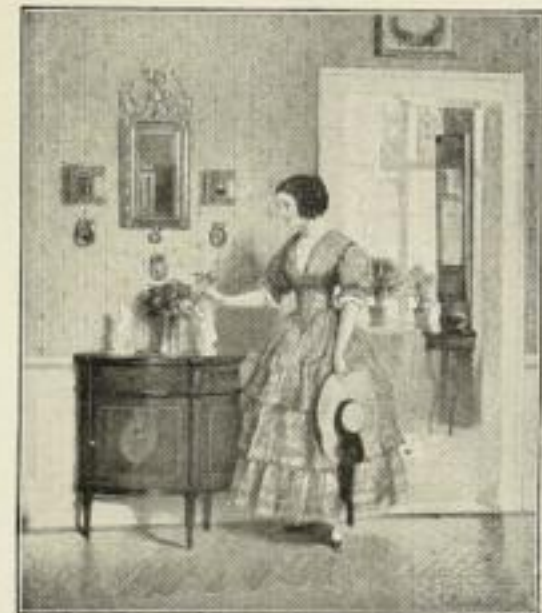
273. Bayerlein: Tage der Rosen. 43 x 51 cm. 11.— GM.