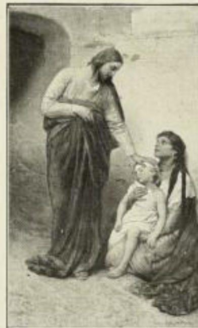
262. G. v. Max: Jesus heilt ein krankes Kind Bild 42x73 cm. 15.— GM.