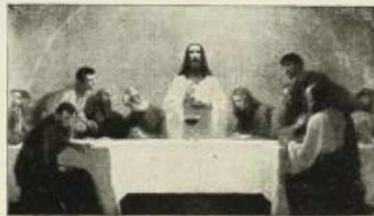
193. Fugel: Abendmahl, 57x100 cm. 20.— GM.