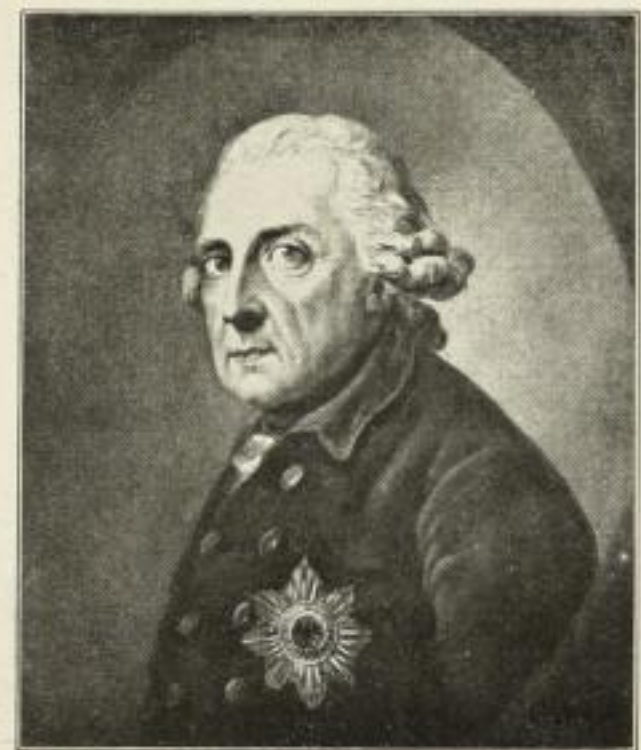
236. Groff: Friedrich d. Große. 43 x 54 cm. 11.— GM.