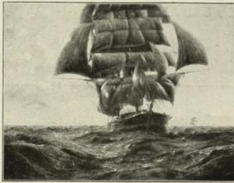
188. von Petersen: Hochsee. 71 x 92 cm. 20.— GM.