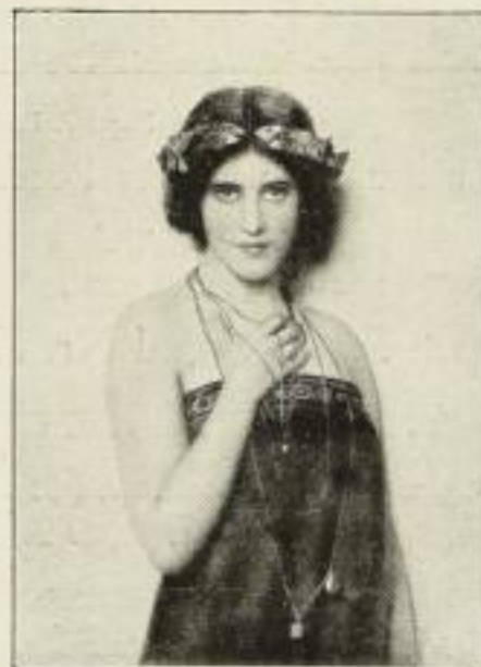
180. Nonnenbruch: Jugend. 44 x 63 cm. 15.— GM.