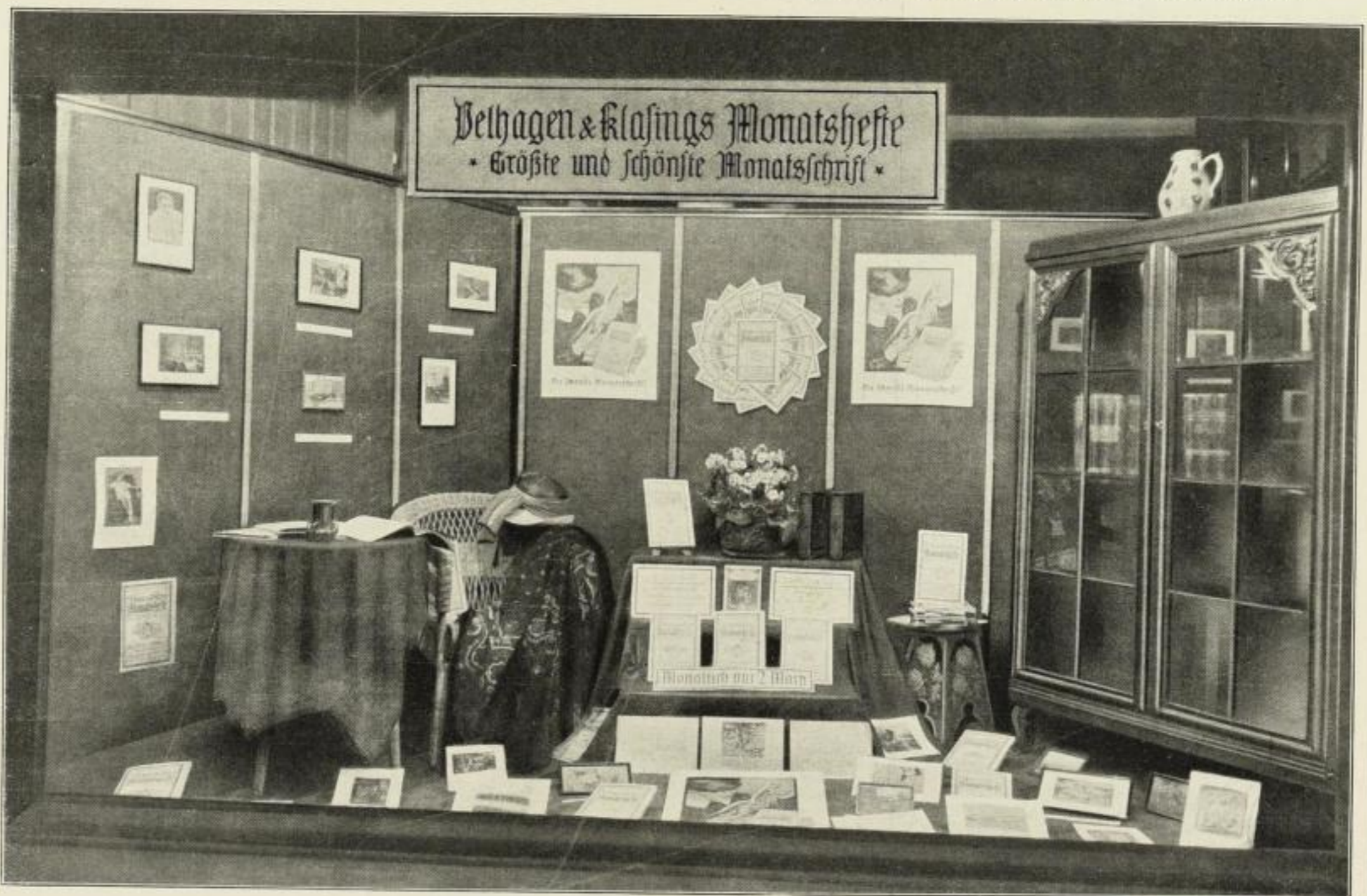
Sonderfenster der Firma F. Tigges, Gütersloh