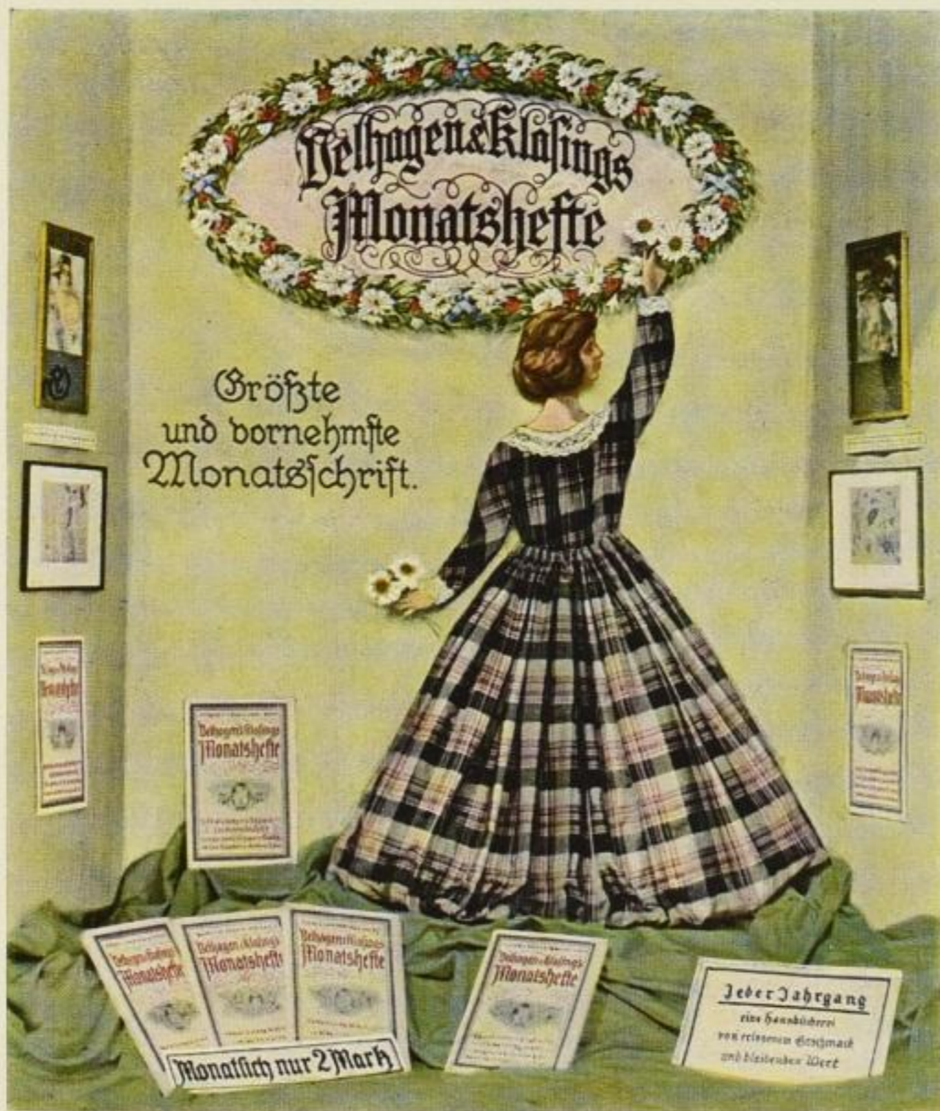
1. Sonderfenster der Firma E. A. Ody (A. Lochner), Eger