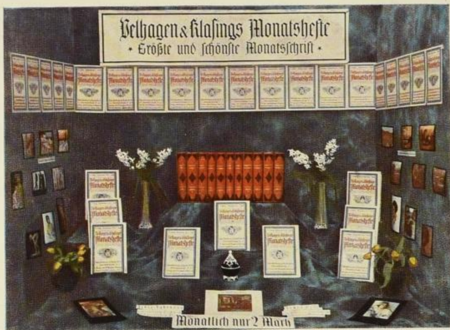
Sonderfenster der Firma Rudolf Schneider, Friedland

Als Ausstellungsmaterial können wir liefern: