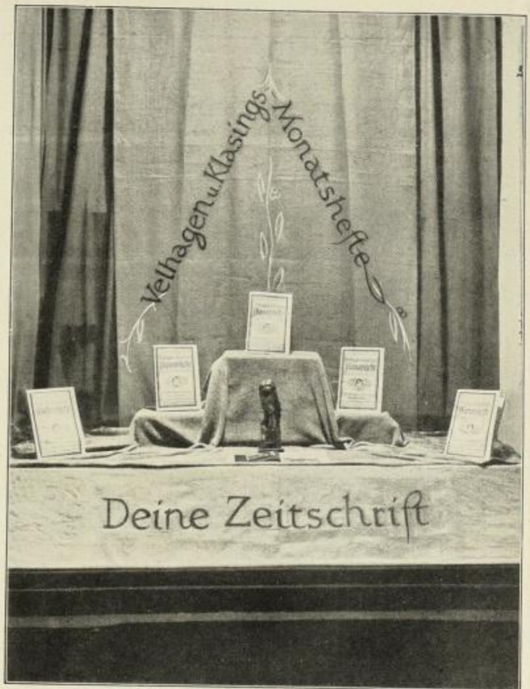
Sonderfenster der Firma H. L. Schlapp, Hofbuchh., Darmstadt