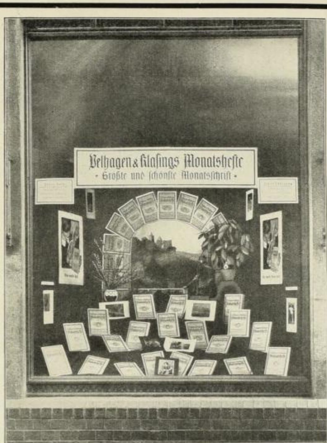
Sonderfenster der Firma Max Röder S. m. b. H., Mülheim (Ruhr)