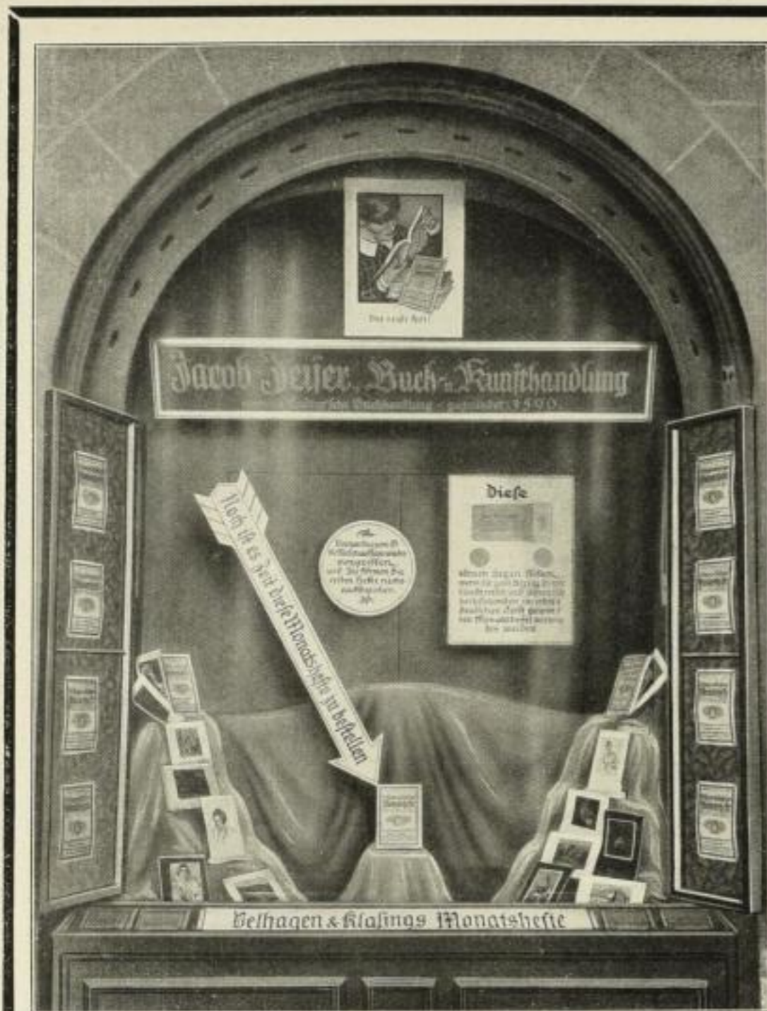
Sonderfenster der Firma Jacob Zeiser, Nürnberg