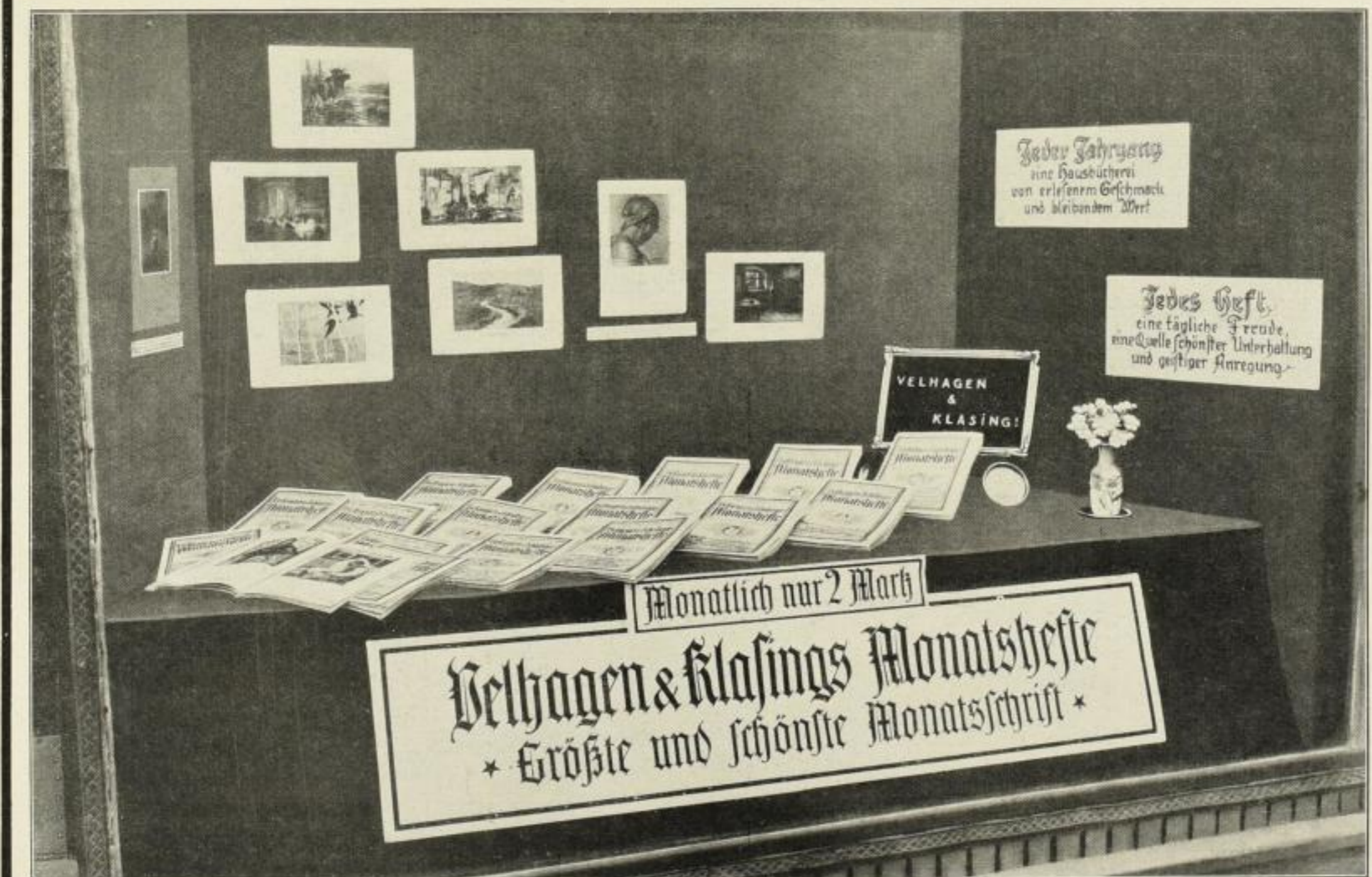
Sonderfenster der Firma Ollmann & Hinke, Berlin-Friedenau