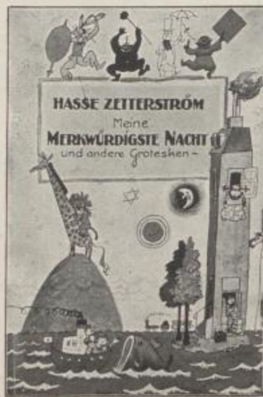
Meine merkwürdigste Nacht