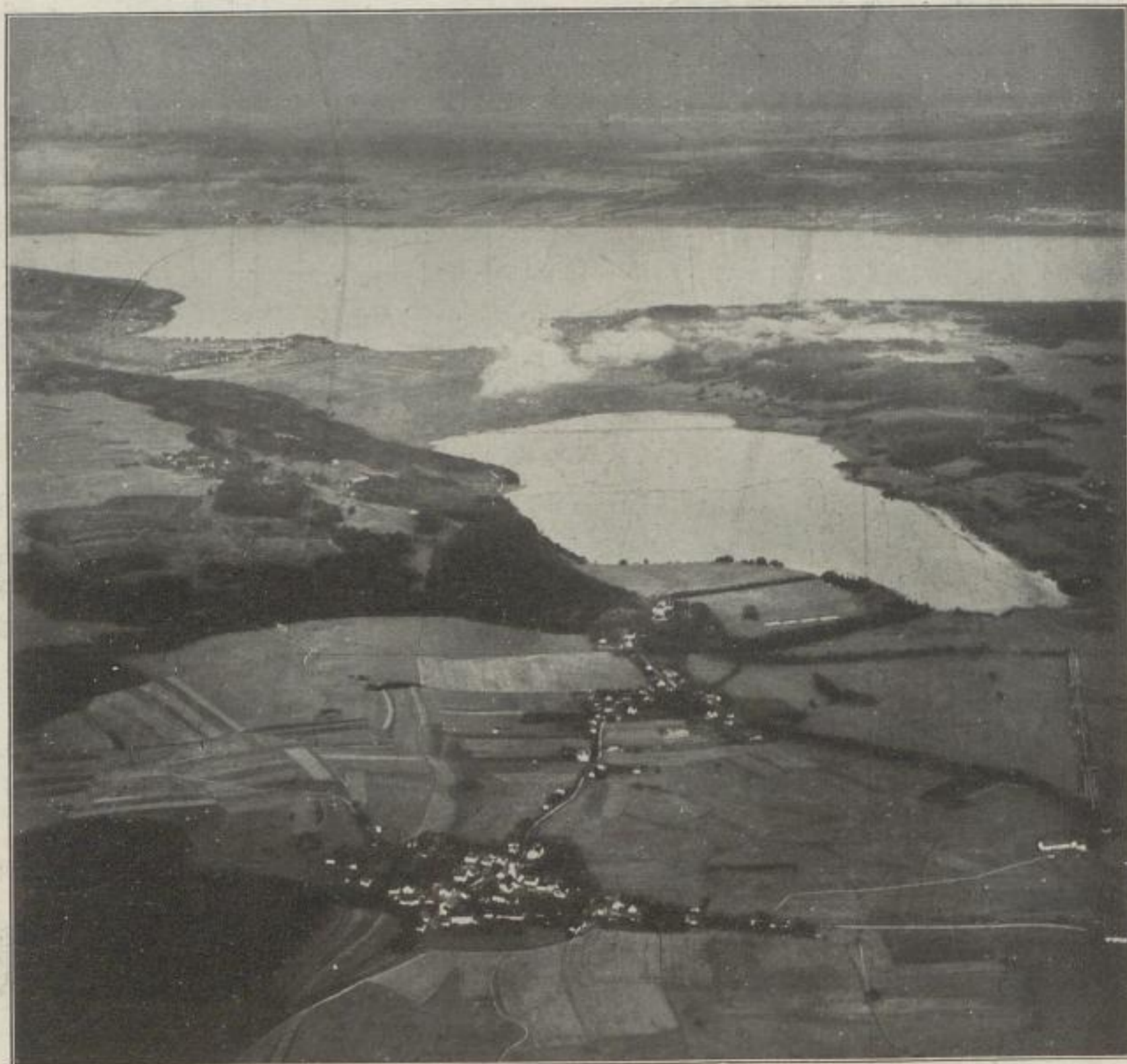
Pilsen- und Ammersee

Bei Vorausbestellung jeder Anzahl mit 50%, später 40% Rabatt