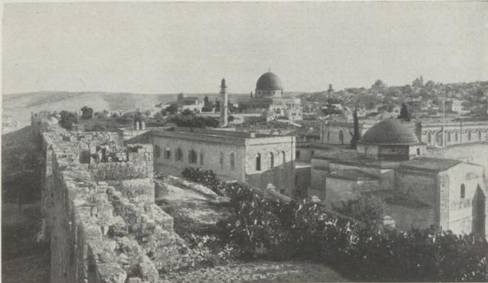
Jerusalem / Blick auf Stadt und Tempelplatz von der Ostmauer (Stark verkleinerte Abbildung)