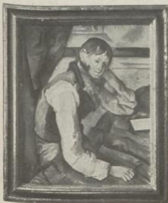
Nr. 22. Cézanne: Der Junge mit der roten Weste. Privatbesitz. (79:63 cm). M. 40.—, Rahmen M. 45.—, Museumrahmen M. 80.—

Europäischer Kunst anzuschaffen. „Schon die Auswahl ist eine Erfrischung“ schrieb Gerhart Hauptmann. Da natürlich die Piper-Drucke erst gerahmt ihre letzte Wirkung entfalten, wurde zu jedem einzelnen Blatt ein stilreicher Rahmen nach altem Original geschaffen, keine Fabrikarbeit sondern jeder eine gediegene handwerkliche Leistung. Die Preise der Drucke und Rahmen sind möglichst niedrig gehalten.