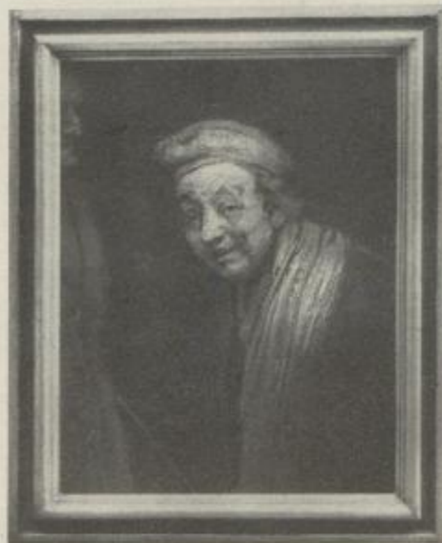
Nr. 2. Rembrandt: Lachendes Selbstbildnis. München. (79:62 cm) M. 40.—, Rahmen M. 45.—, Museumrahmen M. 80.—

sind möglichst getreue, farbige Wiedergaben von Gemälden und Pastellen in Einzelblättern grossen Formates. Verantwortungsvoll und ohne Rücksicht auf Zeit und Geld wird die Annäherung jedes einzelnen Bildes an sein Original bis zur äussersten Grenze getrieben. Und ebenso sorgsam ist die Auswahl der Werke, die es jedem ernsthaften Kunstfreund erlaubt, sich eine Galerie der wesentlichsten Werke