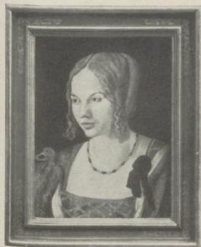
Nr. 25. Dürer: Venezianisches Frauenbildnis. Wien (32:24 cm). M. 15.—, Rahmen M. 12.—, Museumrahmen M. 35.—