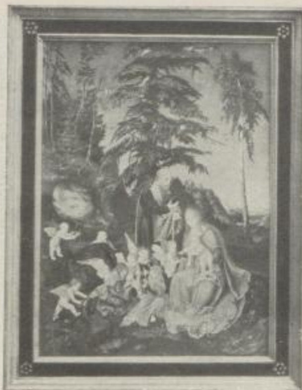
Nr. 30. Cranach: Ruhe auf der Flucht. Berlin (55:41 cm). M. 25.—, Rahmen M. 40.—