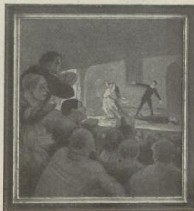
Nr. 4. Daumier: Das Drama. München (69:64 cm). M. 35.—, Rahmen M. 45.—