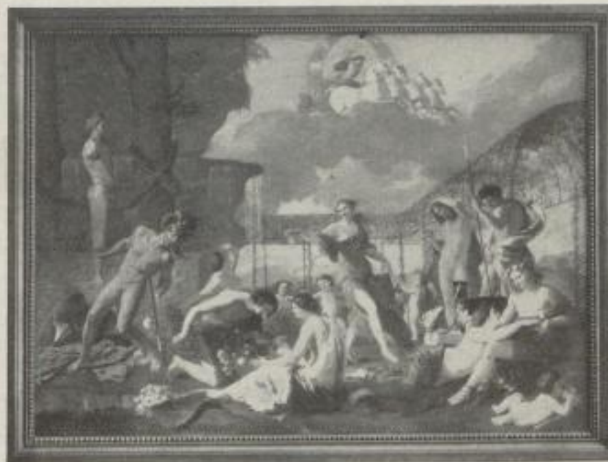
Nr. 19. Poussin: Das Reich der Flora. Dresden. (68:94 cm.) M. 40.—, Rahmen M. 45.—