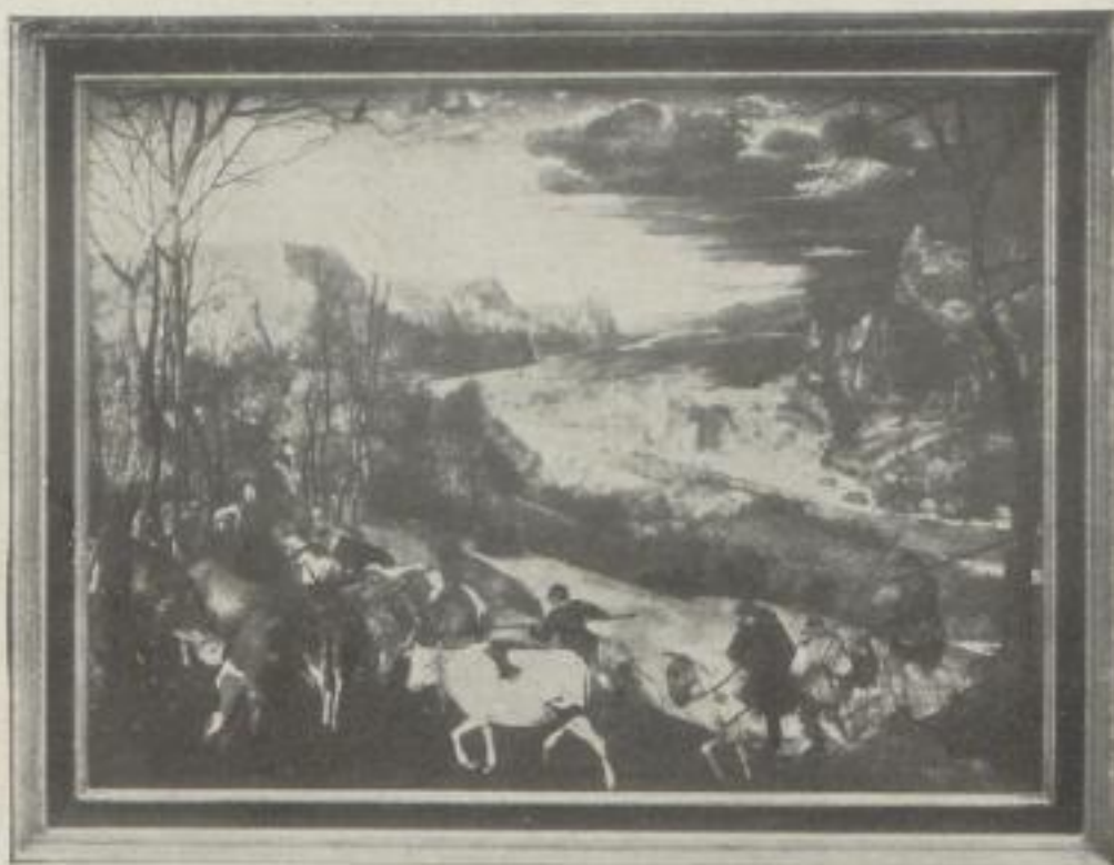
Nr. 24. Bruegel der Ältere: Der Herbst, Wien (54,5:64,5 cm). M. 30.—, Rahmen M. 45.—