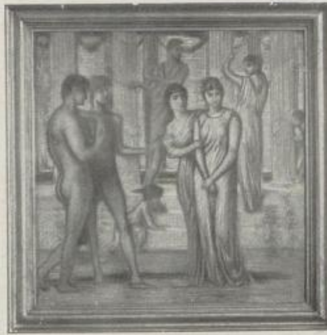
Nr. 20. Marées: Die Werbung. Pastell. Berlin (70:70 cm). M. 40.—, Rahmen M. 50.—