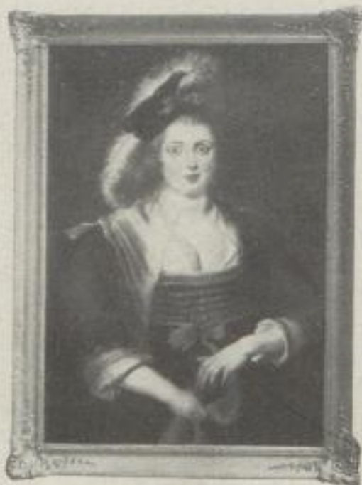
Nr. 31. Rubens: Helene Fourment. München (62:88,5 cm). M. 40.—, Rahmen M. 50.— Museumsrahmen M. 70.—