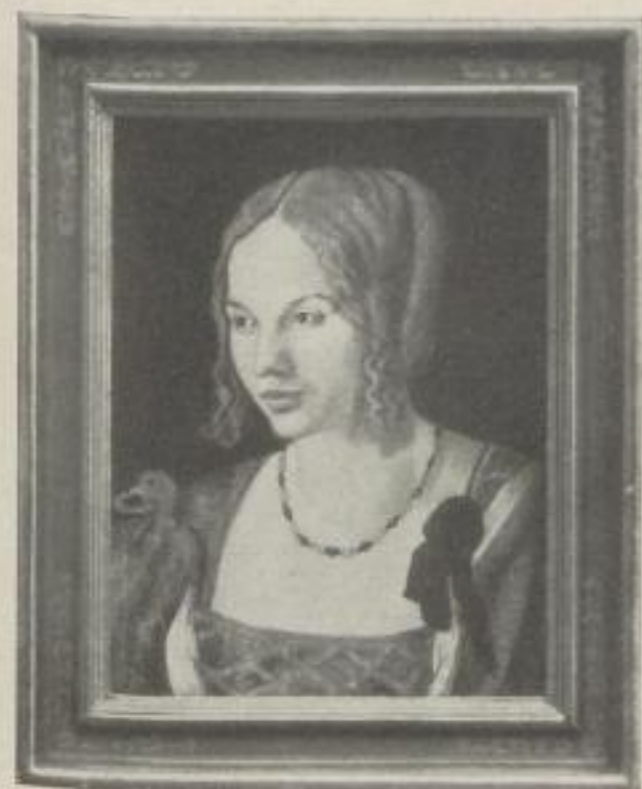
Nr. 25. Dürer: Venezianisches Frauenbildnis, Wien (32:24 cm). M. 15.—, Rahmen M. 12.—, Museumrahmen M. 35.—