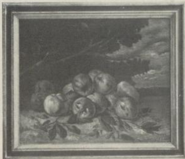
Nr. 16. Courbet: Apfelstilleben, München (49:60 cm). M. 35.—, Rahmen M. 40.—