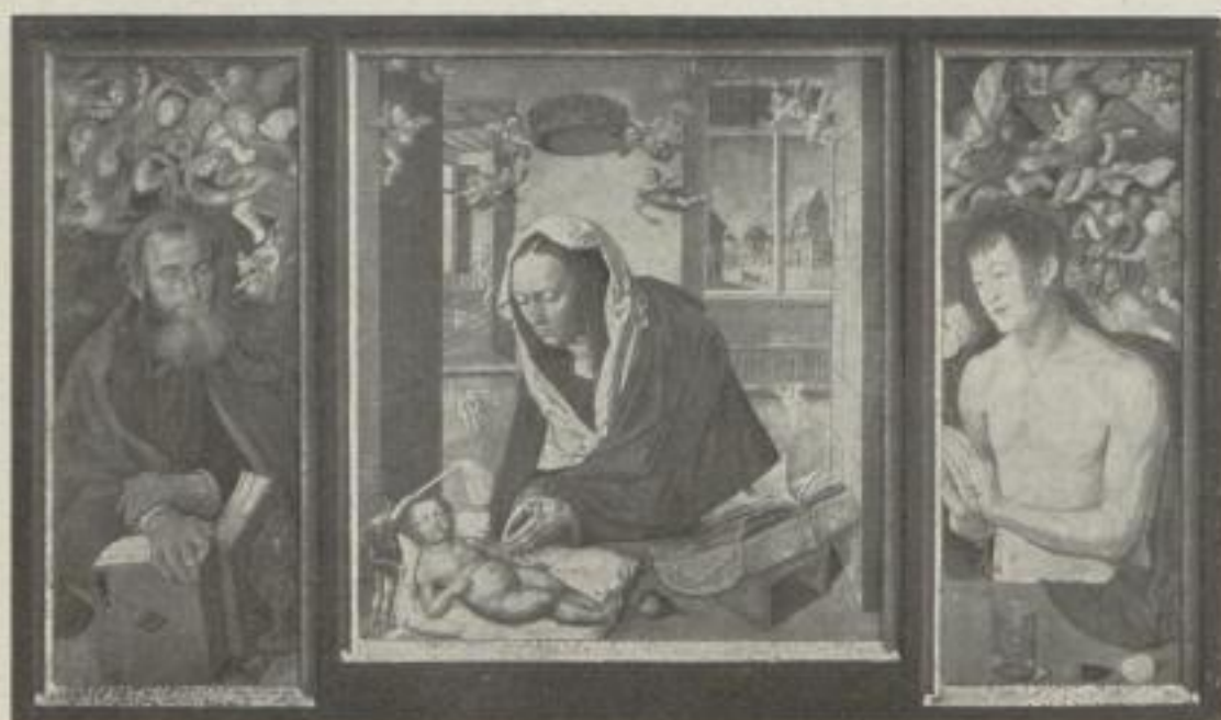
Nr. 1. Dürer: Der Dresdener Altar, Dreiflügelbild. Das Mittelbild (53:47,5 cm), M. 35.—. Die Flügelbilder (56:22 cm), je M. 15.—, Rahmen M. 50.—