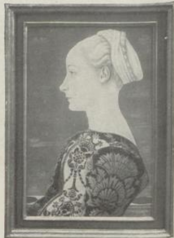
Nr. 26. Veneziano: Mädchenbildnis, Berlin (52:34,5 cm). M. 25.—, Rahmen M. 35.—