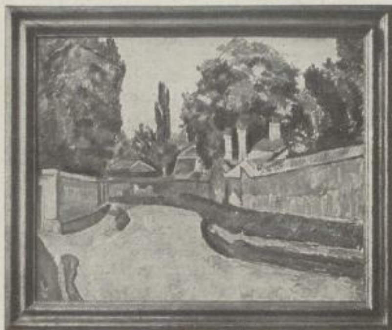
Nr. 21. Cézanne: Die Dorfstraße. Berlin (58:72 cm). M. 35.—, Rahmen M. 45.— Museumsrahmen M. 80.—