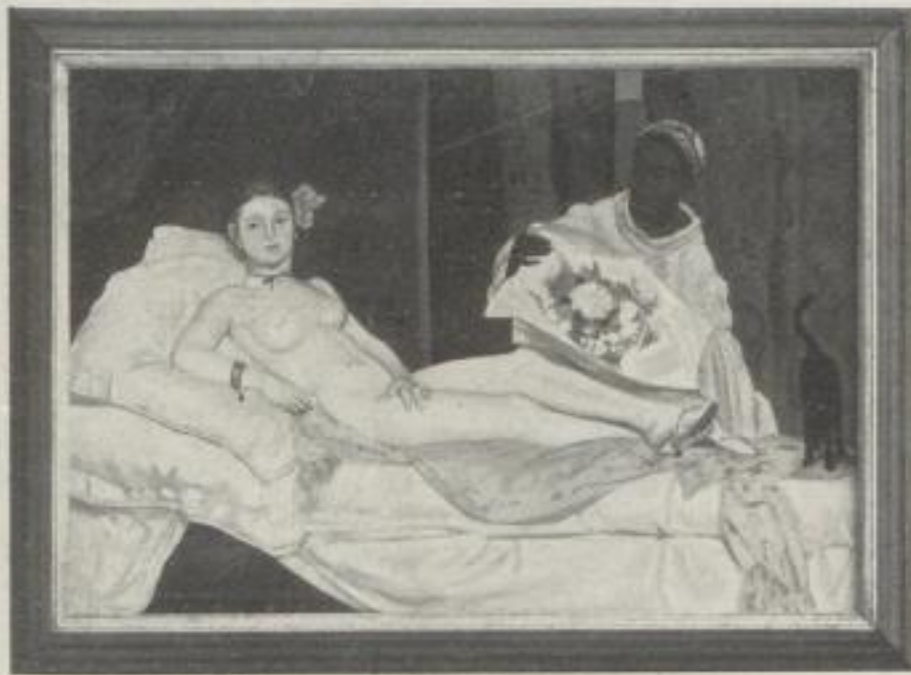
Nr. 5. Manet: Olympia. Paris. (45:66 cm) M. 35.—, Rahmen M. 27.—