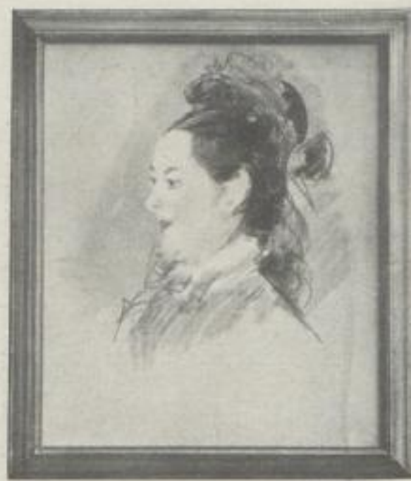
Nr. 6. Manet: Frauenbildnis, Pastell, Berlin (59:50 cm). M. 30.—, Rahmen M. 27.—