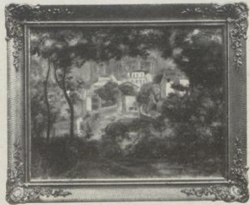
Nr. 18. Renoir: Blick auf Montmartre. München. (32:40 cm) M. 25.—, Rahmen M. 30.—