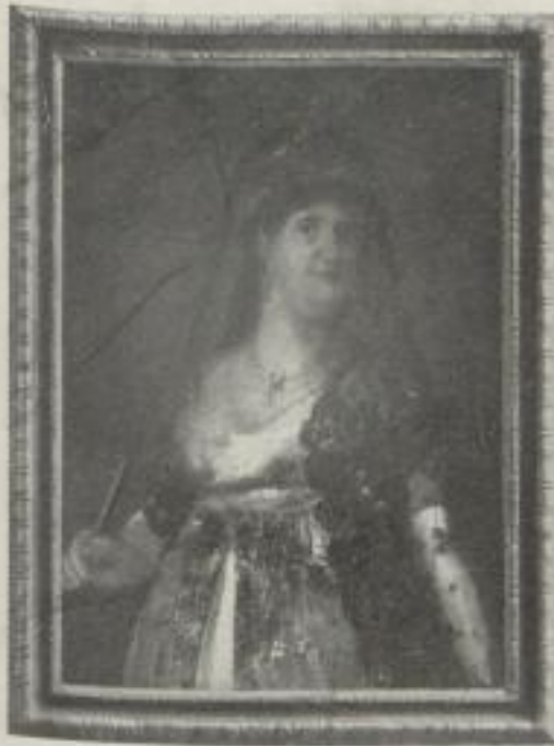
Nr. 5. Goya: Königin Maria Luise von Spanien München. (89:63 cm). M. 40.—, Rahmen 45.—, Museumsrahmen M. 60.—