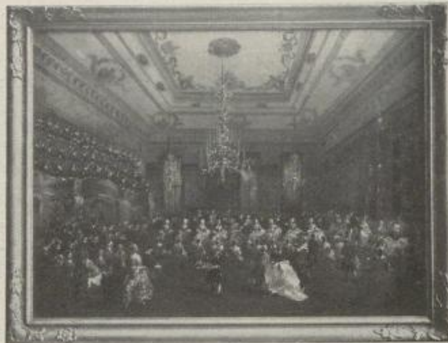
Nr. 15. Guardi: Galakonzert in Venedig. München (64:88 cm). M. 40.—, Rahmen M. 50.—