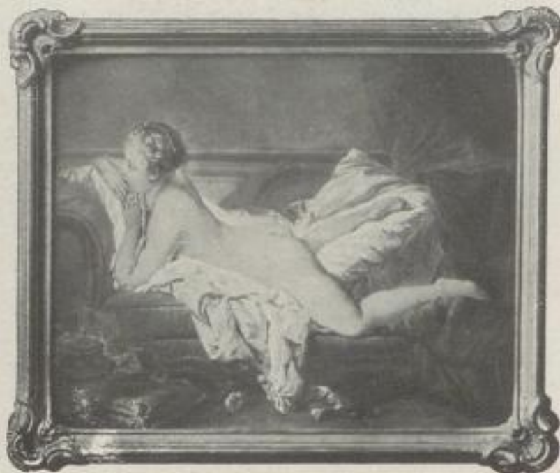
Nr. 14. Boucher: Liegendes Mädchen. (57:71 cm) M. 35.—, Rahmen M. 45.—, Museumsrahmen M. 65.—