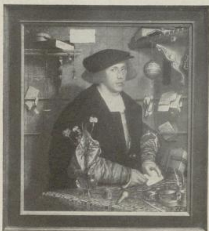
Nr. 29. Holbein: Kaufmann Giese, Berlin (64:57 cm). M. 30.—, Rahmen M. 45.—