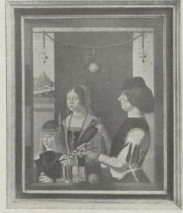
Nr. 12. Estense: Familienbildnis. München (74:60 cm). M. 40.—, Rahmen M. 45.— Museumsrahmen M. 60.—