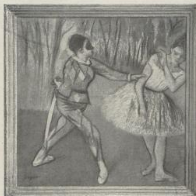
Nr. 8. Degas: Harlekin und Columbine. Berlin (43:43 cm). M. 30.—, Rahmen M. 22.—