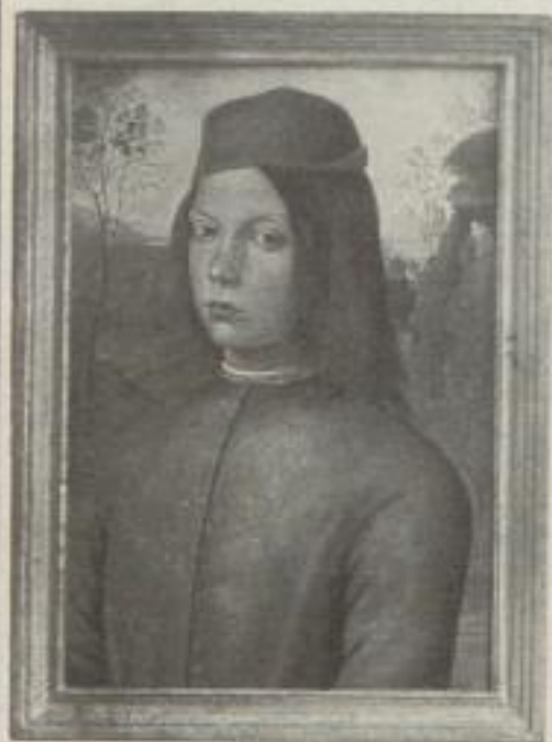
Nr. 11. Pinturicchio: Knabenbildnis, Dresden (46:31 cm). M. 25.—, Rahmen M. 24.—

Wir liefern mit 40% Rabatt, zeh'n Bilder gemischt mit 45%. Bestellzettel anbei!