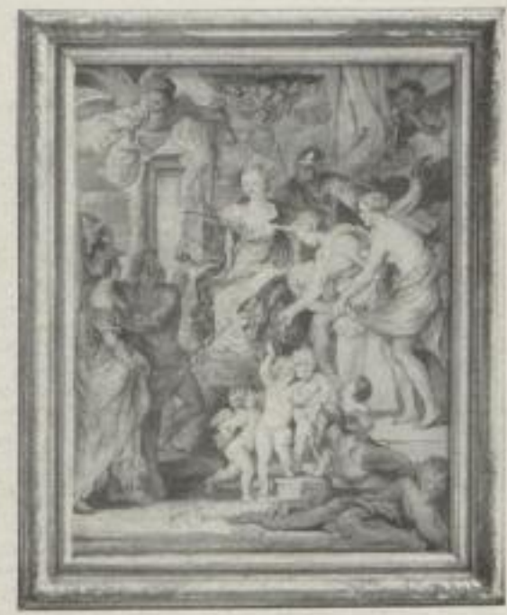
Nr. 13. Rubens: Der Friede (Aus dem Medici-Zyklus). München. (64:49 cm). M. 35.—, Rahmen M. 35.—, Museumsrahmen M. 55.—

GUSTAV PAULI: Die Piper-Drucke sind das Vollkommenste, was in der Wiedergabe von Gemälden bisher geleistet worden ist, und da auch das Format dem der Originale entspricht, so wird die Täuschung vollendet, sobald man solch einen Druck unter Glas und Rahmen vor sich hat.