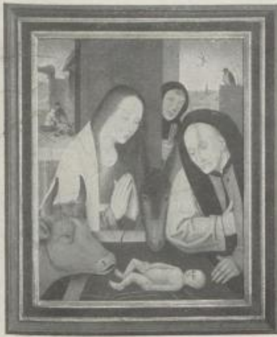
Nr. 9. Bosch: Anbetung der Hirten, Köln (54:40 cm). M. 30.—, Rahmen M. 45.— Museumsrahmen M. 55.—