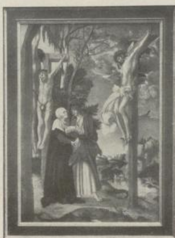
Nr. 10. Cranach: Kreuzigung, München (88:62 cm). M. 40.—, Rahmen M. 50.—