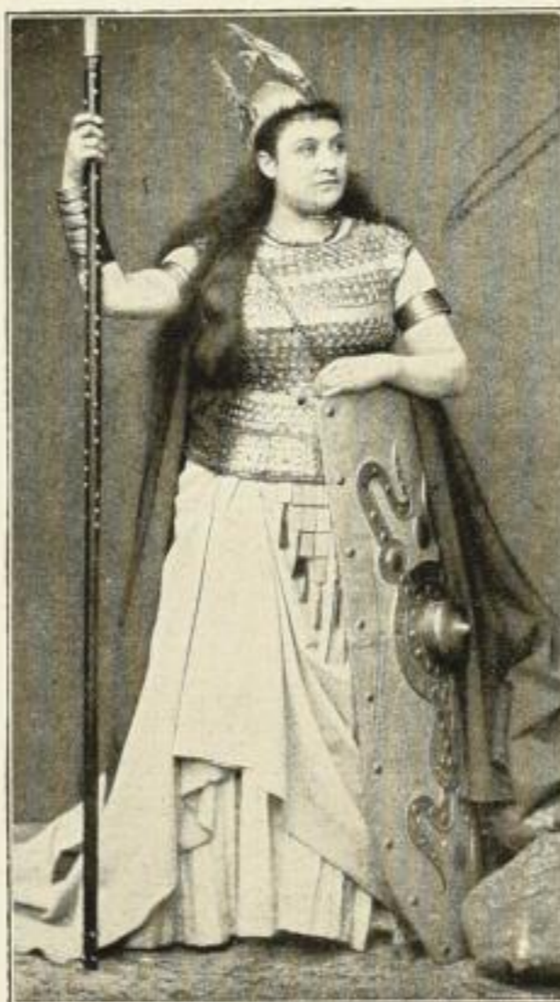
Die falsche Brünbilde

Claus bietet auf dem Gebiet der Rassenforschung etwas völlig Neues. Er hat erkannt, daß die Arbeits- und Betrachtungsweise der den Körper messenden und beschreibenden Anthropologie für die Erkenntnis und Darstellung der Seele doch nicht ausreicht. Sie vermag zwar einen Katalog seelischer Merkmale und Eigenschaften aufzustellen und darin viel Treffendes zu sagen, das innere Wesen einer Rasse, ihre seelische Artung, ihren Stil, all das, worin sie sich trotz gleichbenannter „Eigenschaften“ (Mut, Verschlossenheit, Verstand usw.) von anderen Rassen unterscheidet, vermag nur geisteswissenschaftliche Forschung auf-