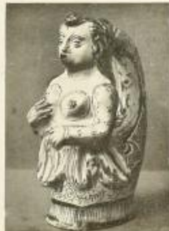
Illustrationsprobe (stark verkleinert)