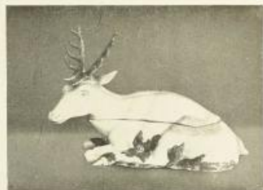
Illustrationsprobe (stark verkleinert)