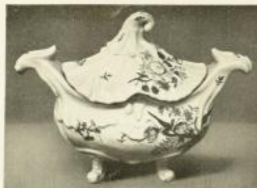
Illustrationsprobe (stark verkleinert)