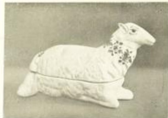
Illustrationsprobe (stark verkleinert)