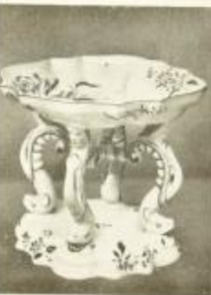
Illustrationsprobe (stark verkleinert)