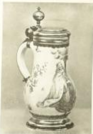
Illustrationsprobe (stark verkleinert)