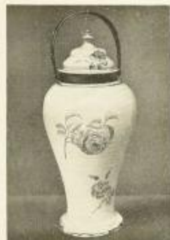
Illustrationsprobe (stark verkleinert)

Man hat die Sallmayersche Buchhandlung in Wien I, Neuer Markt 6.