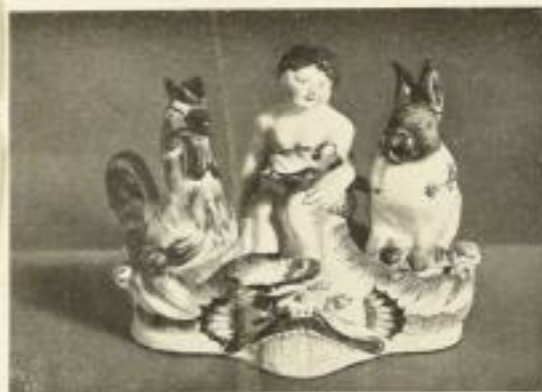
Illustrationsprobe (stark verkleinert)

Die Auslieferung für Österreich, Ungarn, Jugoslawien, Bulgarien und