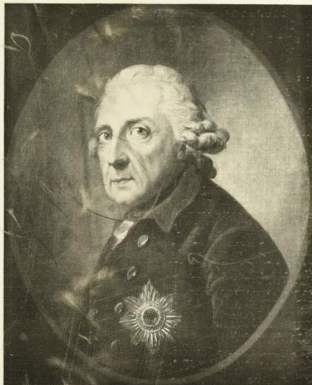
Der König, Gemälde von Graff