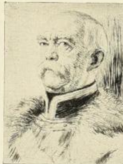
Nr. 301 Bismarck 6.—