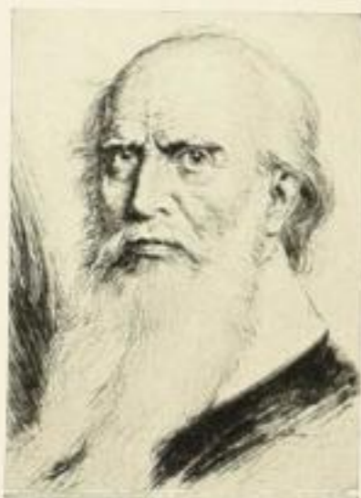
Nr. 325 Jahn 6.—