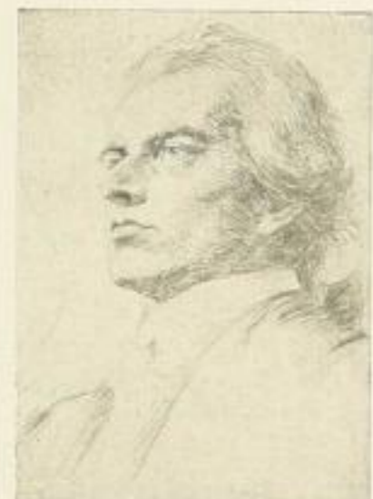
Nr. 308 Schiller 6.—