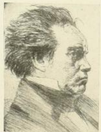
Nr. 305 Beethoven 6.—