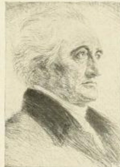
Nr. 312 Goethe 6.—