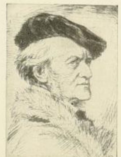
Nr. 306 Wagner 6.—