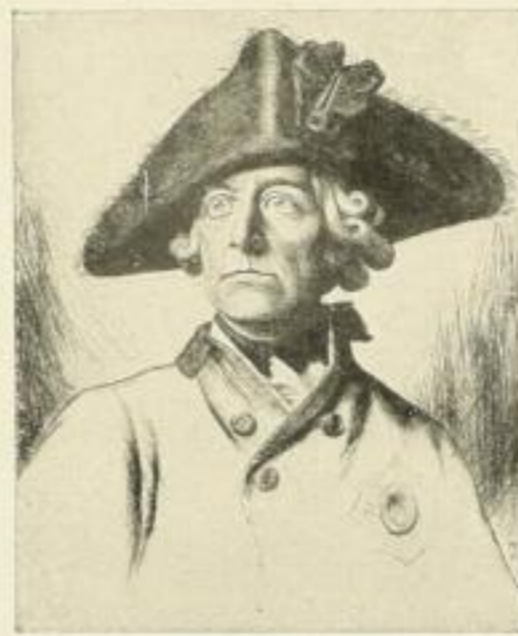
Nr. 177. Finné, Friedrich II. 30x40 cm 15.— Nr. 162 24x30 cm 7.50 Nr. 161 12x14 cm 1.50