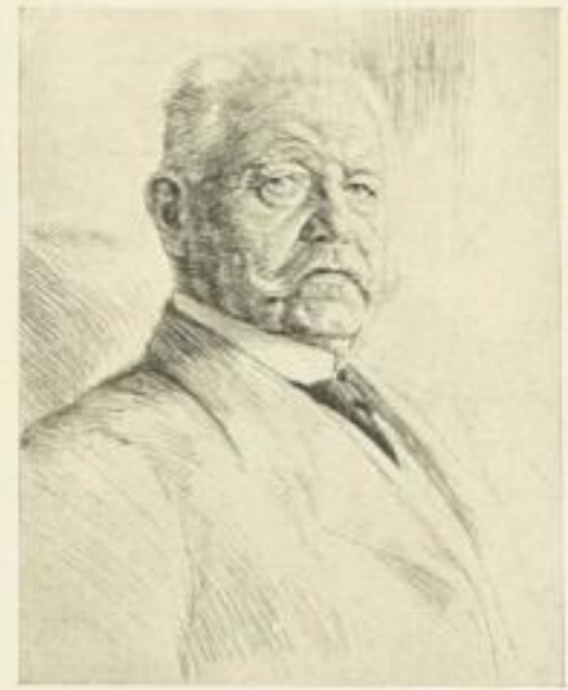
Nr. 345 v. Hindenburg 24x30 cm 12.—