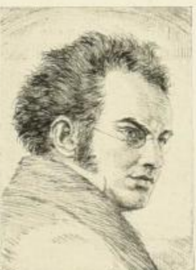
Nr. 316 Schubert 6.—