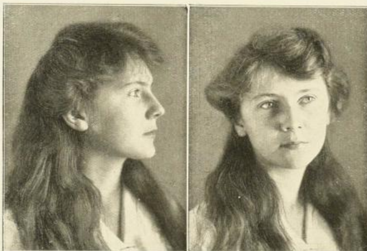
Stilunterschied zwischen Profil (rein nordisch) und Vorderansicht (ostbaltischer Einschlag)