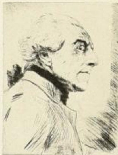
Nr. 300. Friedrich II. 6.—