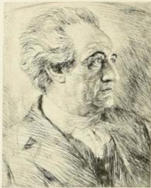
Nr. 344 Goethe 24x30 cm 12.—