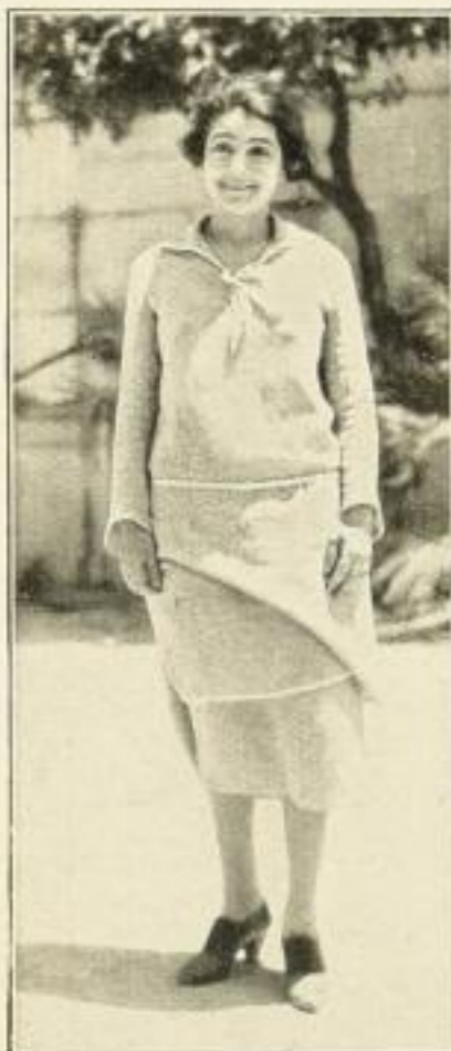
Mitteländisch (7. Kap. Die Bühne des Lebens)

Unser Groß-Sortiment enthält Kunstblätter aller bekannten Verlage Wir liefern zu Original-Verlagspreisen und Bedingungen aus.