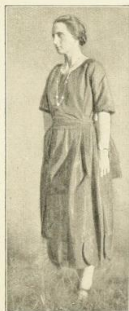
Nordisch (7. Kap. Die Einsamkeit)