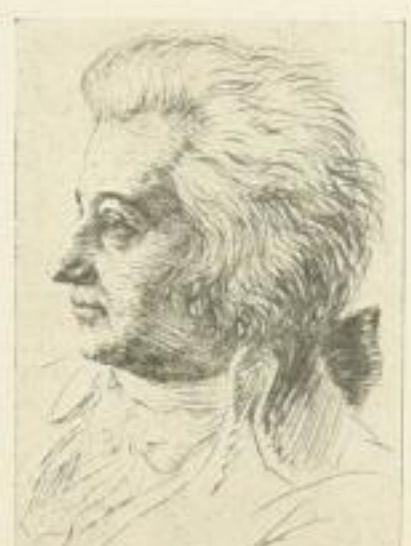
Nr. 307 Mozart 6.—

Ferner sind noch erschienen: Nr. 303 Brahms, Nr. 304 Lortzing, Nr. 305 Beethoven, Nr. 309 Blücher, Nr. 311 Schumann, Nr. 313 Liszt, Nr. 314 Kant, Nr. 315 Schopenhauer, Nr. 316 Schubert, Nr. 317 Reuter, Nr. 318 Bach, Nr. 319 E. M. Arndt, Nr. 327 Rückert, Nr. 328 Frh. v. Stein, in Plattengröße 13x18 cm. Ord. M. 6.—, Nr. 341 Friedrich II., Nr. 349 Liszt in Plattengröße 24x30 cm. M. 12.—, Nr. 342 Friedrich II. mit Dreispitz.