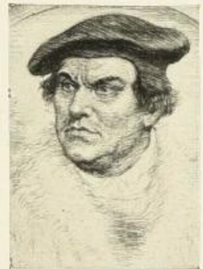
Nr. 320 Luther 6.—

von Nr. 300—328, Format 13x18 cm, Ladenpreis M. 6.—