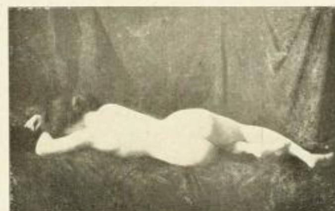
Nr. 4 Gabriel Guay: Far niente 18 × 24 cm RM 1,—