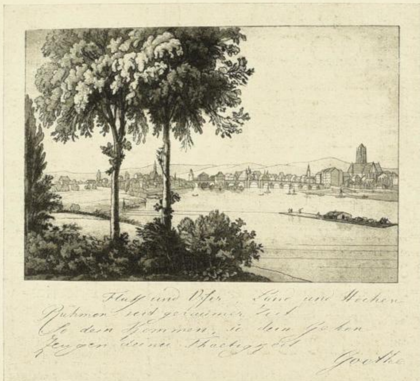
Blick auf Frankfurt von der Gerbermühle, 1819

146 Seiten mit einem Vierfarbdruck und neun Tafeln in Doppeltondruck