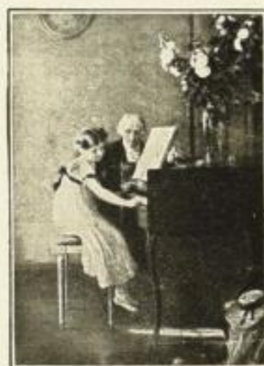
Nr. 16 Muenier: Klavierstunde 18 × 24 cm RM 1,— / 30 × 40 cm RM 3,—