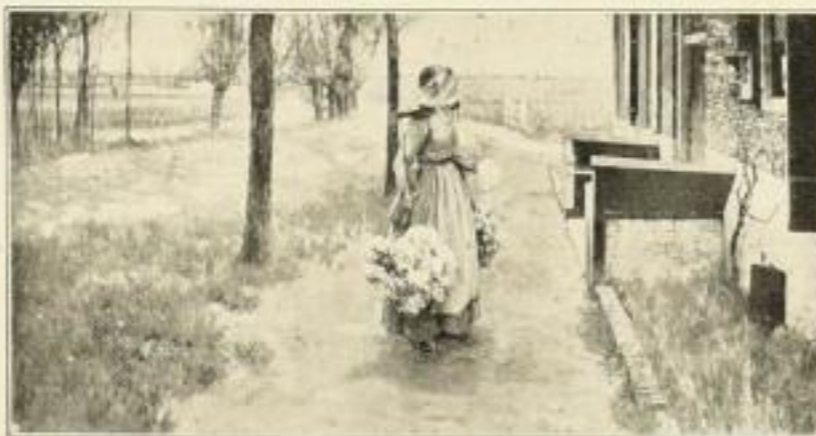
Nr. 117 Hitheok: Holländisches Blumenmädchen 26 x 50 cm RM 12.—