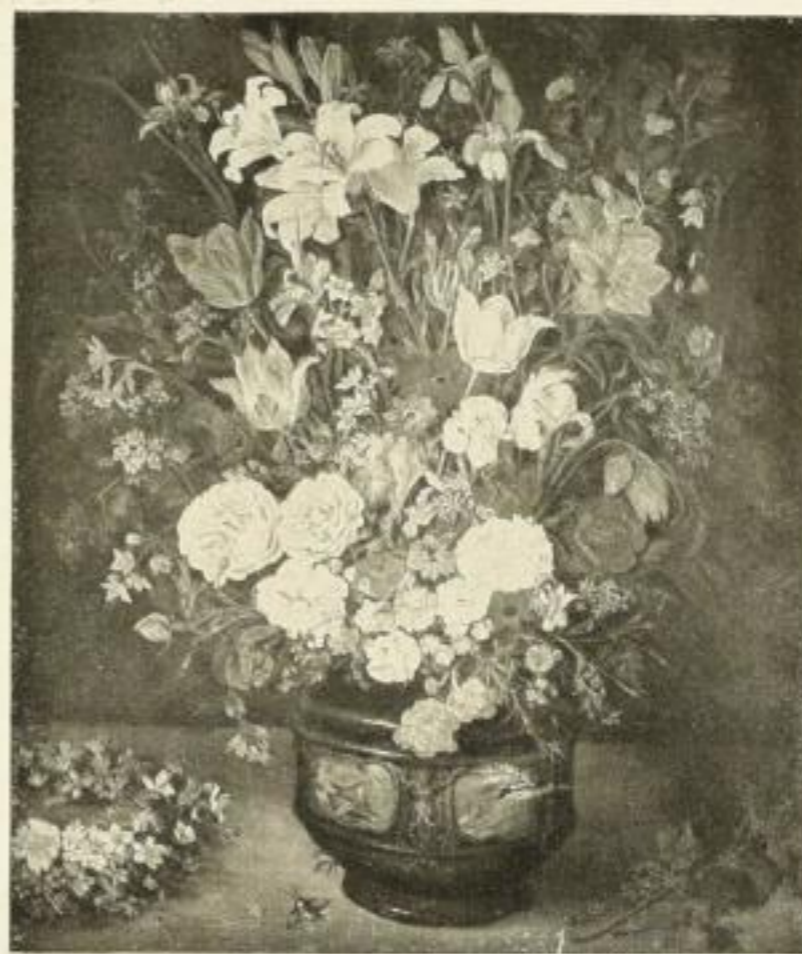
Nr. 91 Bruegel: Blumenstrauß 55 x 65 cm RM 20.—

Farben=Faksimile nach Gemälden im Kaiser Friedrich=Museum