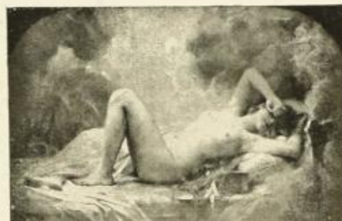
Nr. 7 Comerre: Goldregen 16 × 24 cm RM 1,—