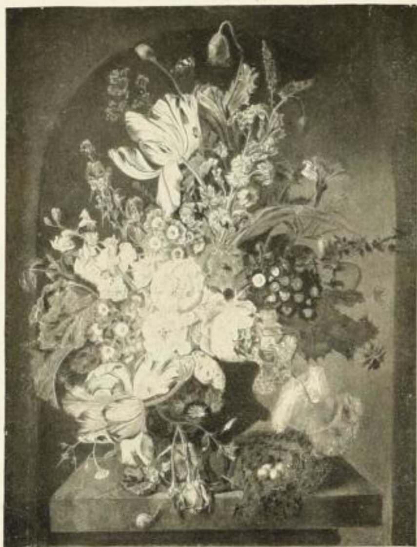
Nr. 92 Huijsum: Blumenstrauß 60 x 80 cm RM 20.—