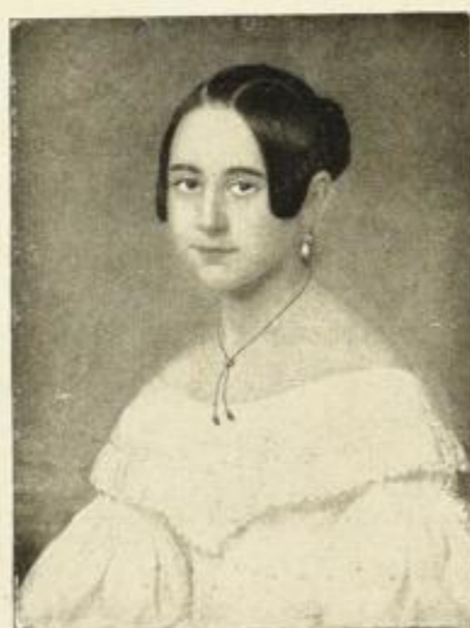
Nr. 85 v. Jagemann: Alt-Wien 20 × 24 cm RM 1,— / 48 × 58 cm RM 20,—