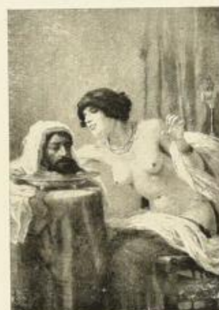
Nr. 20 E. Fischer-Coerlin: Salome 20 × 29 cm RM 1.50