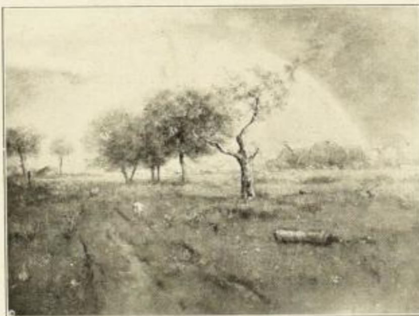
Nr. 114 George Inness: Nach dem Regen 30 x 40 cm RM 12.—