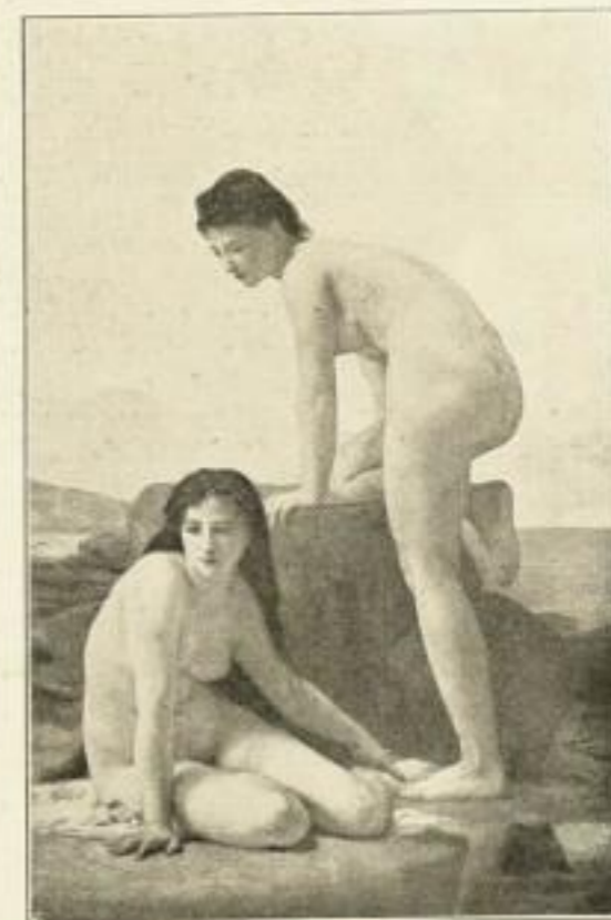
Nr. 119 Bougerau: Die Badenden 30 x 40 cm RM 12.—