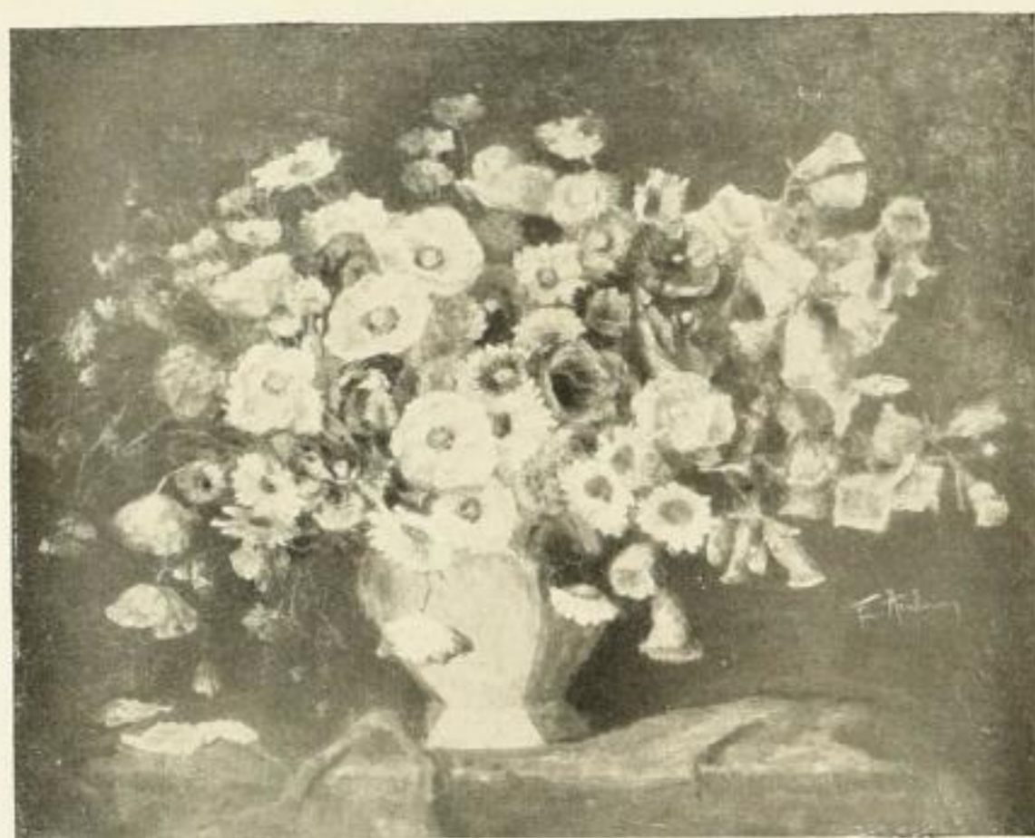
Nr. 121 Arnheim: Feldblumen 60 × 80 cm RM 20,—