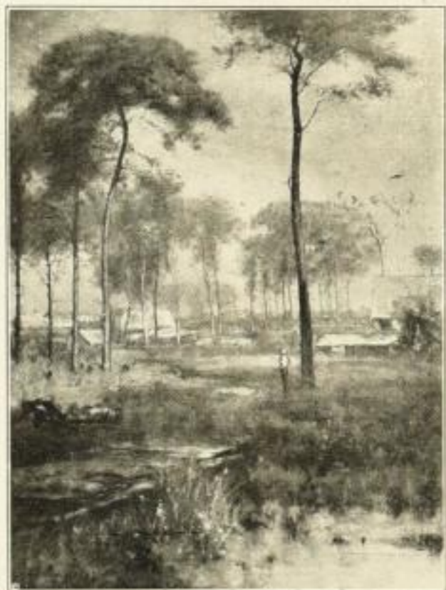
Nr. 116 George Inness: Morgendämmerung 30 x 40 cm RM 12.—

Farben=Faksimile nach Gemälden im Kaiser Friedrich=Museum