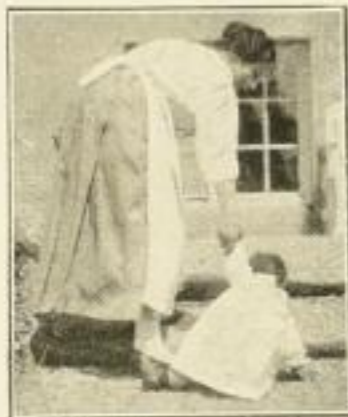
Falsche Führung des Kindes über Stufen

Ein Beweis für die Vortrefflichkeit beider Werke. Eine autoritative Persönlichkeit beurteilt das Buch als „das beste Buch für Kinderpflege“. Verwenden Sie sich bitte für die Werke. Sie leisten damit Pionierdienste gegen die Säuglingssterblichkeit. In Deutschland sterben jährlich gegen 200.000 kleine Kinder an schlechter, mangelhafter Pflege und falscher Ernährungsweise.