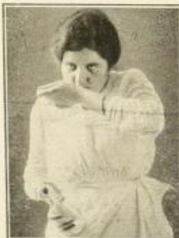
Richtiges Prüfen der Milch auf der Hand