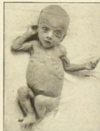
Flaschenkind mit schwerer chronischer Ernährungsstörung