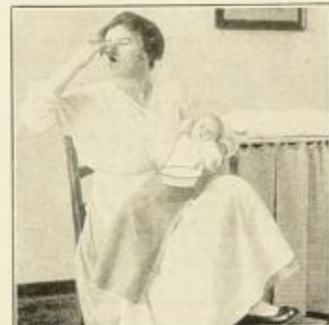
Wie der Brei nicht versucht werden darf

Stark verkleinerte Abbildungen aus dem Werk „Das Kind und seine Pflege“