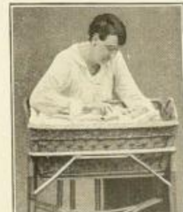
Richtiges Geben der Flasche