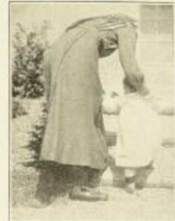
Richtige Führung des Kindes über Stufen