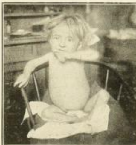
Rachitisches Kind. 2 3/4 Jahre. Kann weder gehen noch sprechen