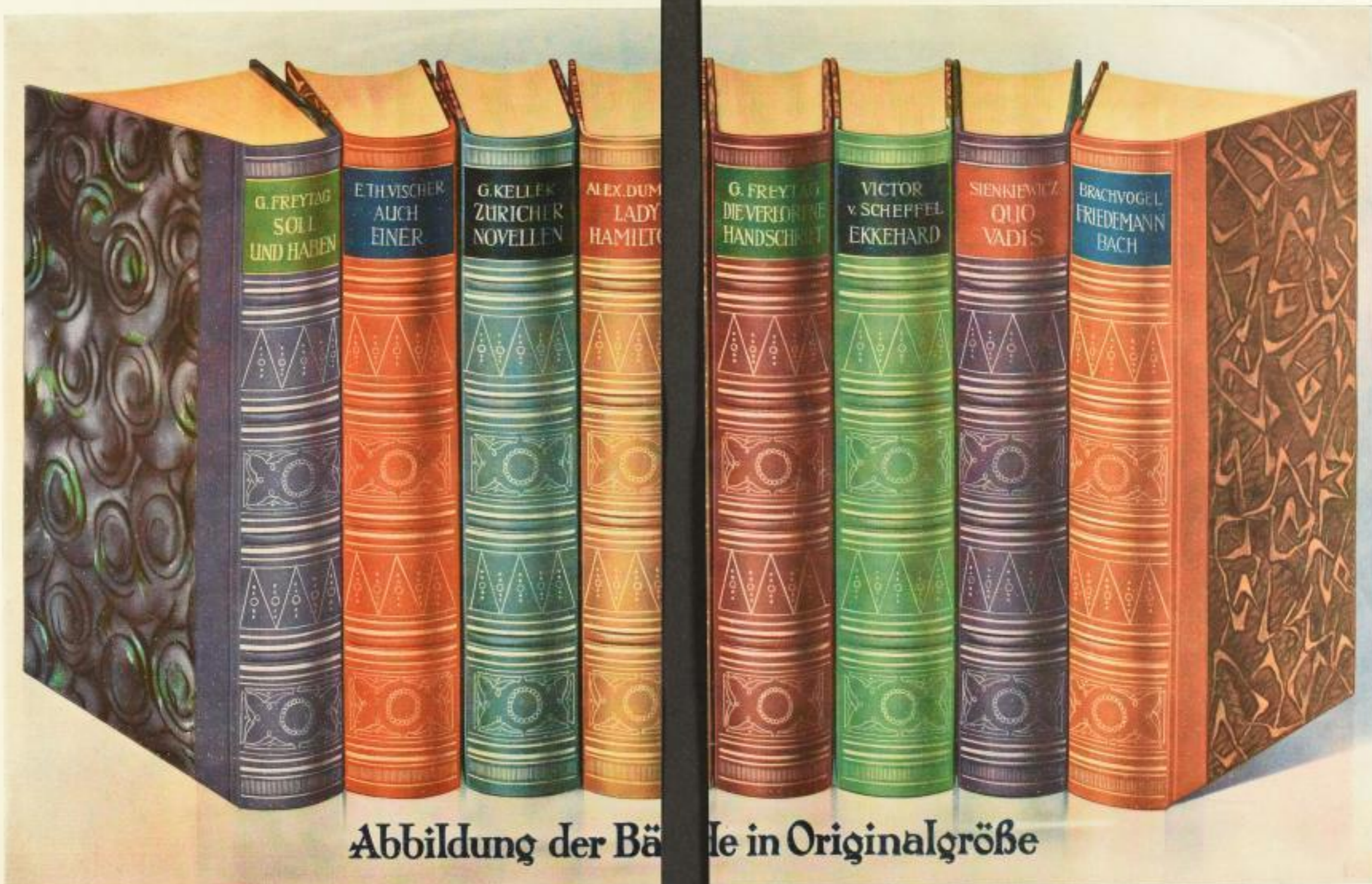
Abbildung der Bände in Originalgröße

Rückenpressung und Kopfgoldschnitt in echtem Feingold!