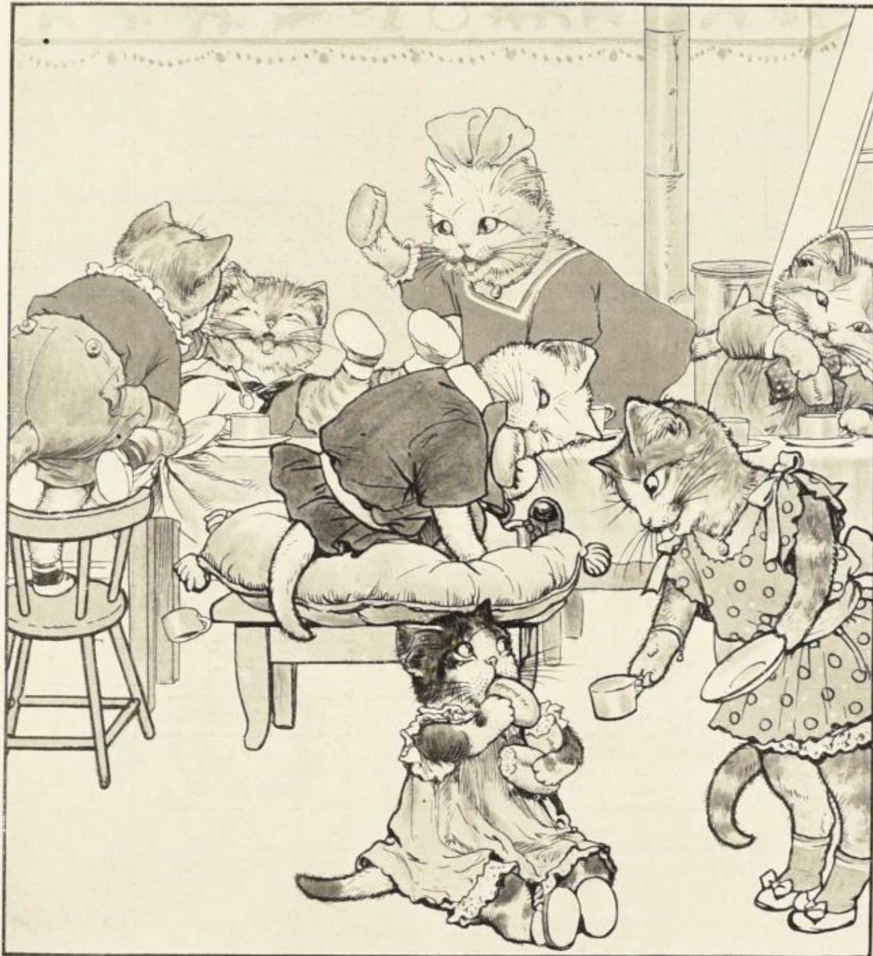
Einfarbige Wiedergabe eines Bildes, im Buche farbig