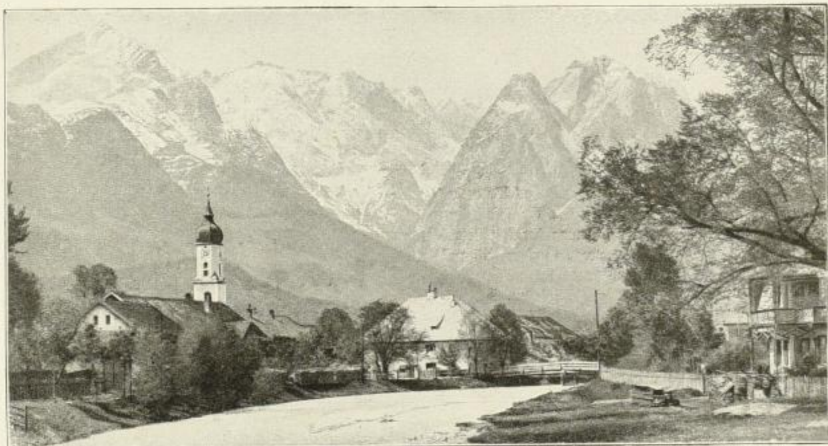
An der Loisach

Der Schwarzwald. Ein deutsches Bergland am Oberrhein / 175 der schönsten Landschaftsbilder in Tiefdruck / Mit Text von Dr. Hermann Schwarzweber / Querquart-Album in Ganzleinwand Rm. 24.—