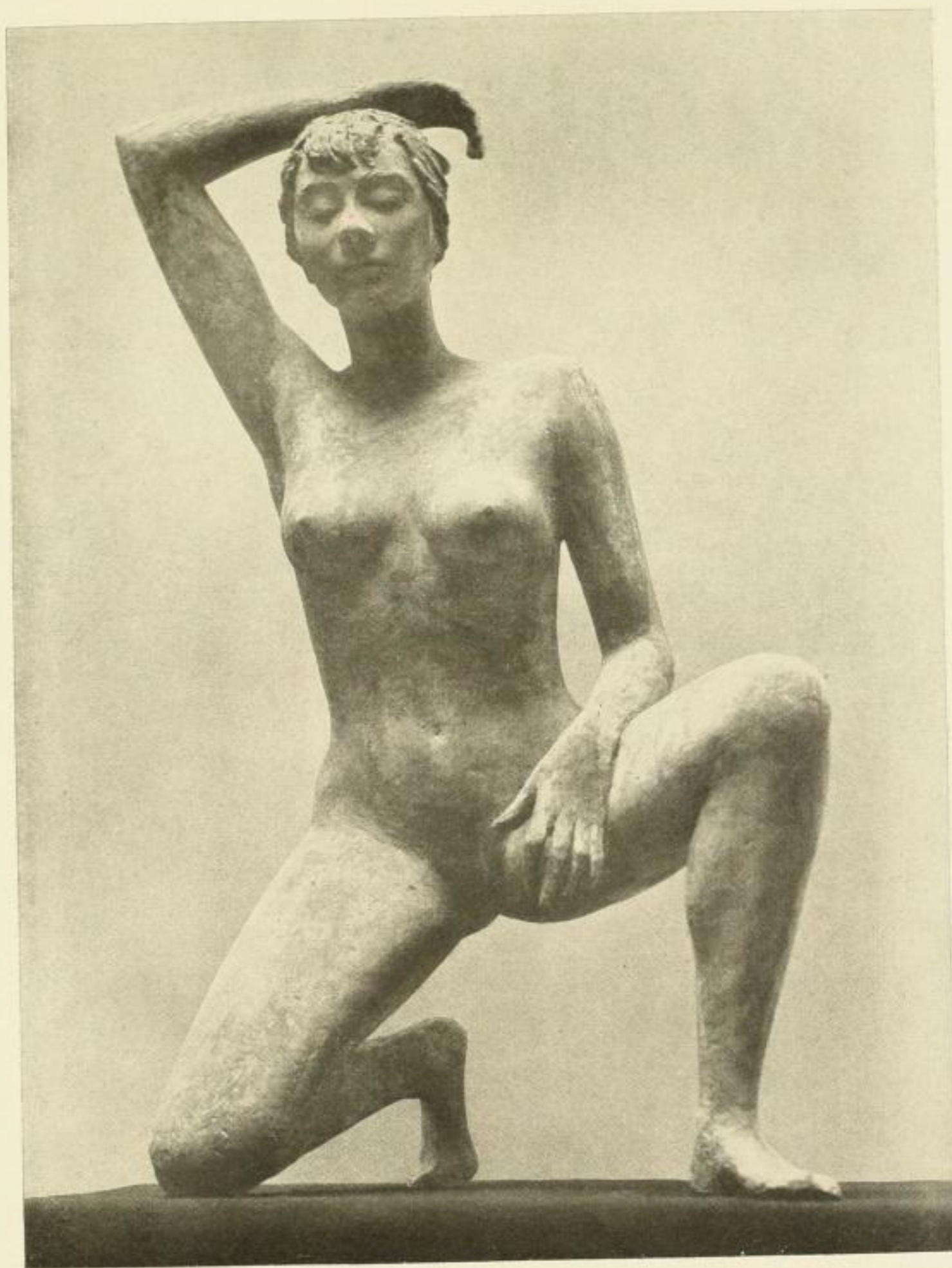
Ernesto de Fiori: Kauernde