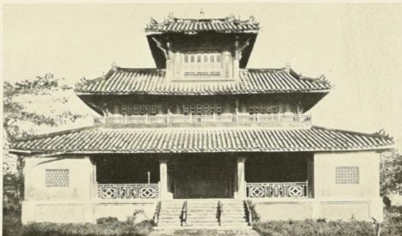
Kaiserlicher Palast in Hué: Eingang zum Hof des The Mieu