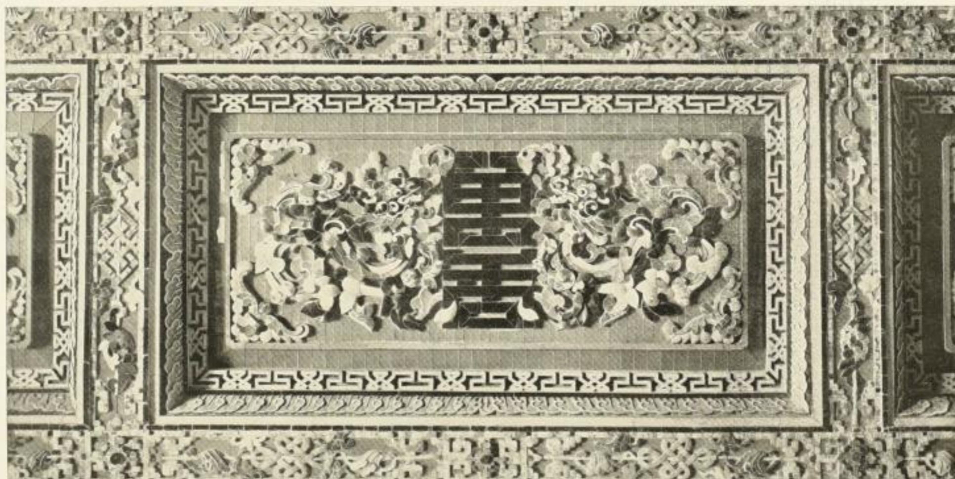
Tempel des Kaisers Khai Dinh bei Hué: Ausschnitt der Wandverkleidung