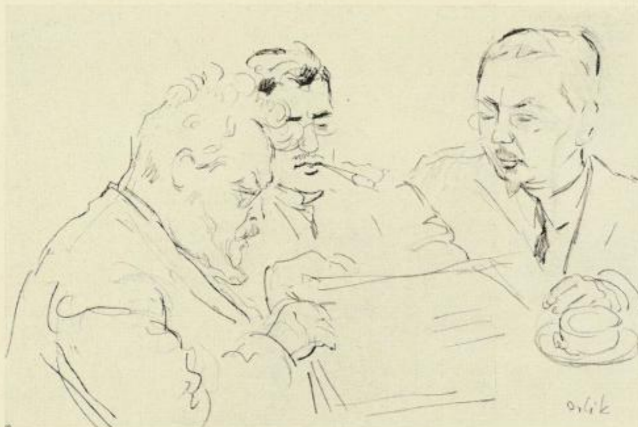
Max Slevogt signiert die zweite Faustlieferung im Romanischen Café Zeichnung von Emil Orlik

DER ZWEITE AKT DES DRAMAS MIT 144 KREIDE- UND FEDERLITHOGRAPHIEN UND 2 RADIERUNGEN