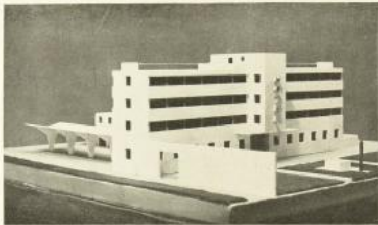
AUS BEHNE, DER MODERNE ZWECKBAU