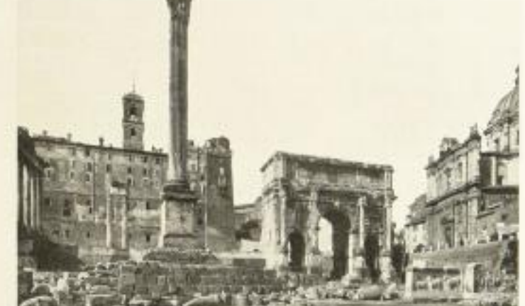
AUS HULSEN, FORUM UND PALATIN

Ein vierseitiger illustrierter Verteilung zur Verfügung.