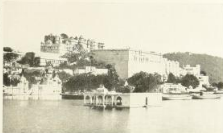
AUS GOTHEIN, INDISCHE GÄRTEN

Der Plan dieser neuen Bücher der Baukunst vom Altertum zur neuesten Zeit, ebenso die näheren und ferneren Orientie- rungen, bedeutende Bauwerke oder wichtige Entwicklungsprobleme in der Baukunst werden in Einzel- Darstellungen behandelt werden. Diese Neuarbeit geleistet werden, umfassend der vielfach zer- splitterten Einzelforschung der Baukunst und künstlerisch über den Stand unserer Zeit werden. Wir hoffen, so schließen zu können. Ent- weder einer biographischen und kun- der Über Bauwerke von allge- z. B. die Peterskirche in Rom- stellungen, die der neuesten Probleme können erst durch Klärung finden. Als letztes Ziel ist — sollte in entscheidend ein Gesamtbild der Geschichte