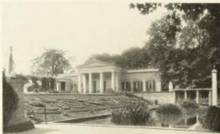
AUS SCHMITZ, KÖNIGSSCHLÖSSER

Ein vierseitiger illustrierter Verteilung zur Verfügung.