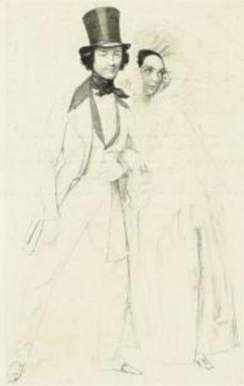
Krüger / Die Taglionis 57,7 × 22,8