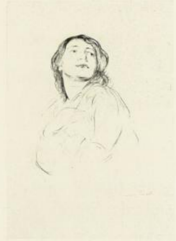
Corinth / Weibl. Halbfigur 49,9 × 54,9