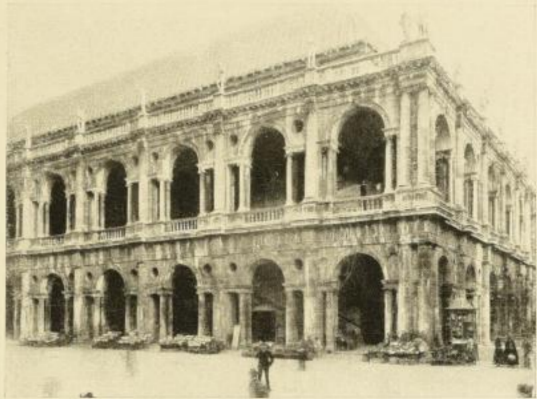
Palladio: Basilika in Vicenza

Kunst geworden. Nun kam der Gegenstoß! Die Renaissance gebar den neuzeitlichen Menschen, der sich, erfüllt von der Welt- und Schönheitsfreude der Antike, kraft- und lustvoll zu seinem Ich bekannte. Diese Wiederentdeckung und Entfesselung der Eigenpersönlichkeit erfolgte mit einer Gewalt,