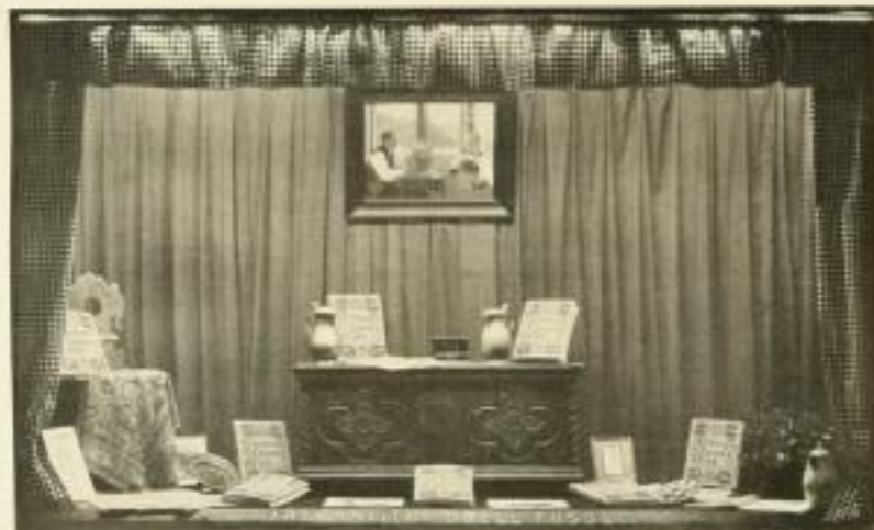
Ein „Schweizer-Bauernkunst“-fenster unteer Büchstube in Zürich

Lurusausgabe (100 numerierte Exemplare auf Bütten) M. 100.- ord.