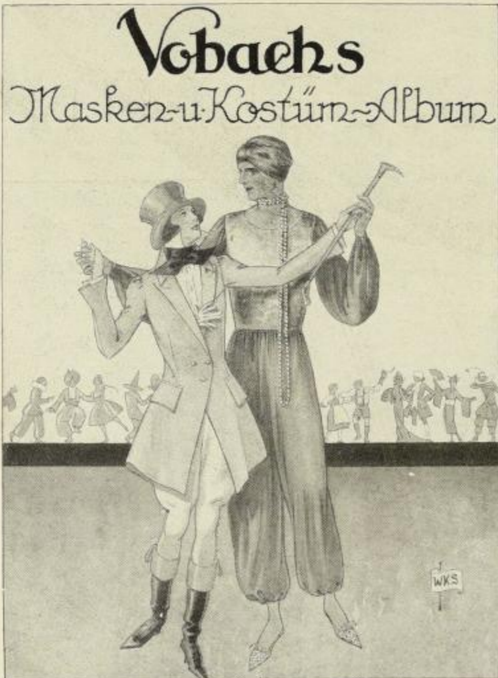
Herausgegeben von Amalie Witte